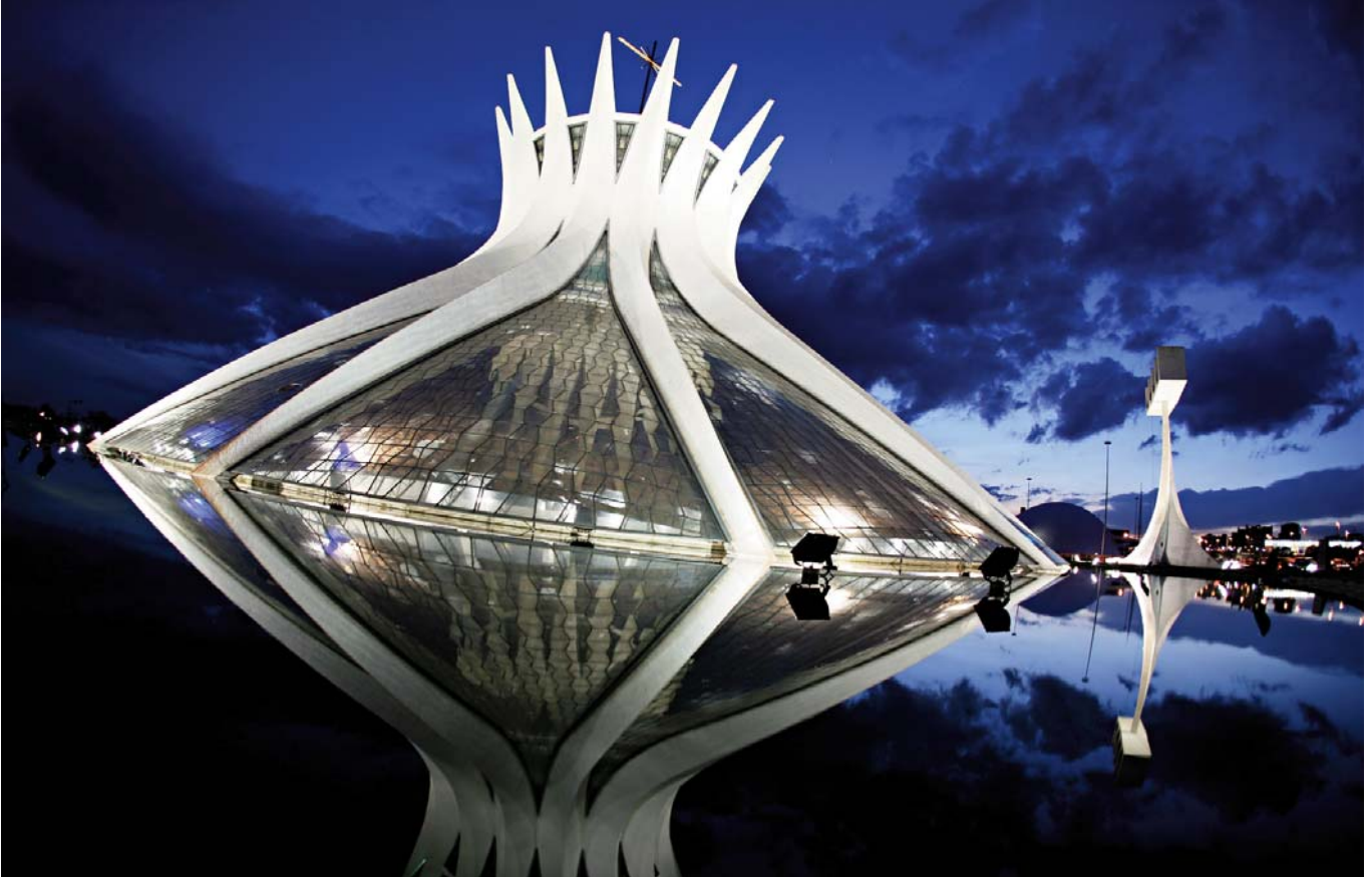
Catedral de Brasilia