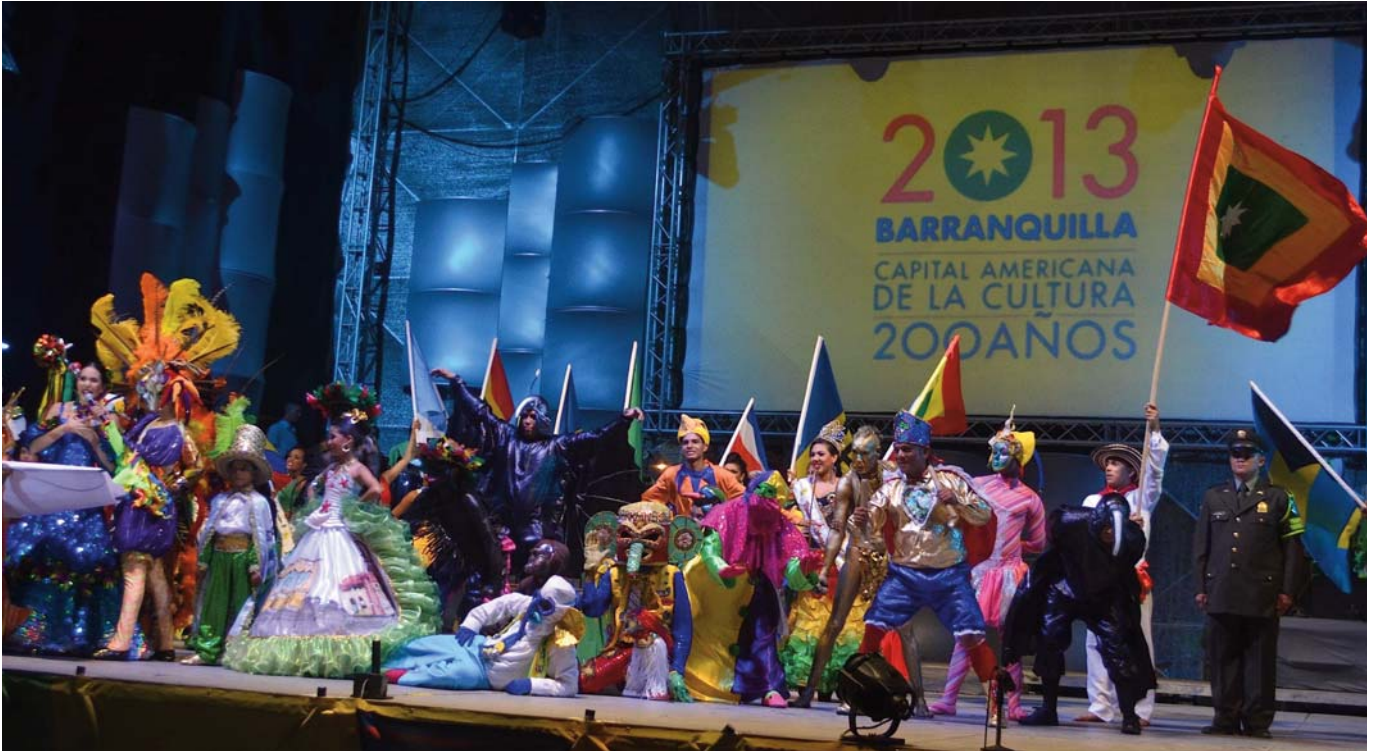
Carnaval de Barranquilla