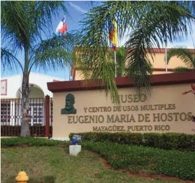
Museo Eugenio María de Hostos