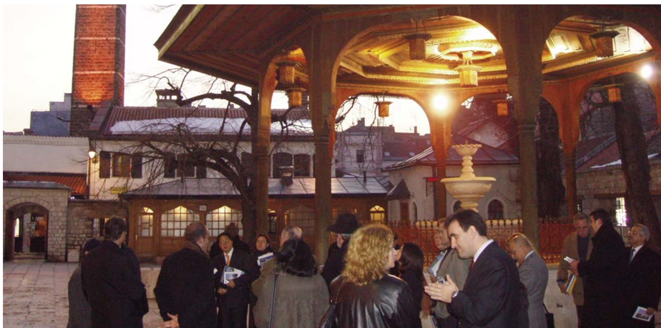
Barrio antiguo de Sarajevo (Bascarsija)