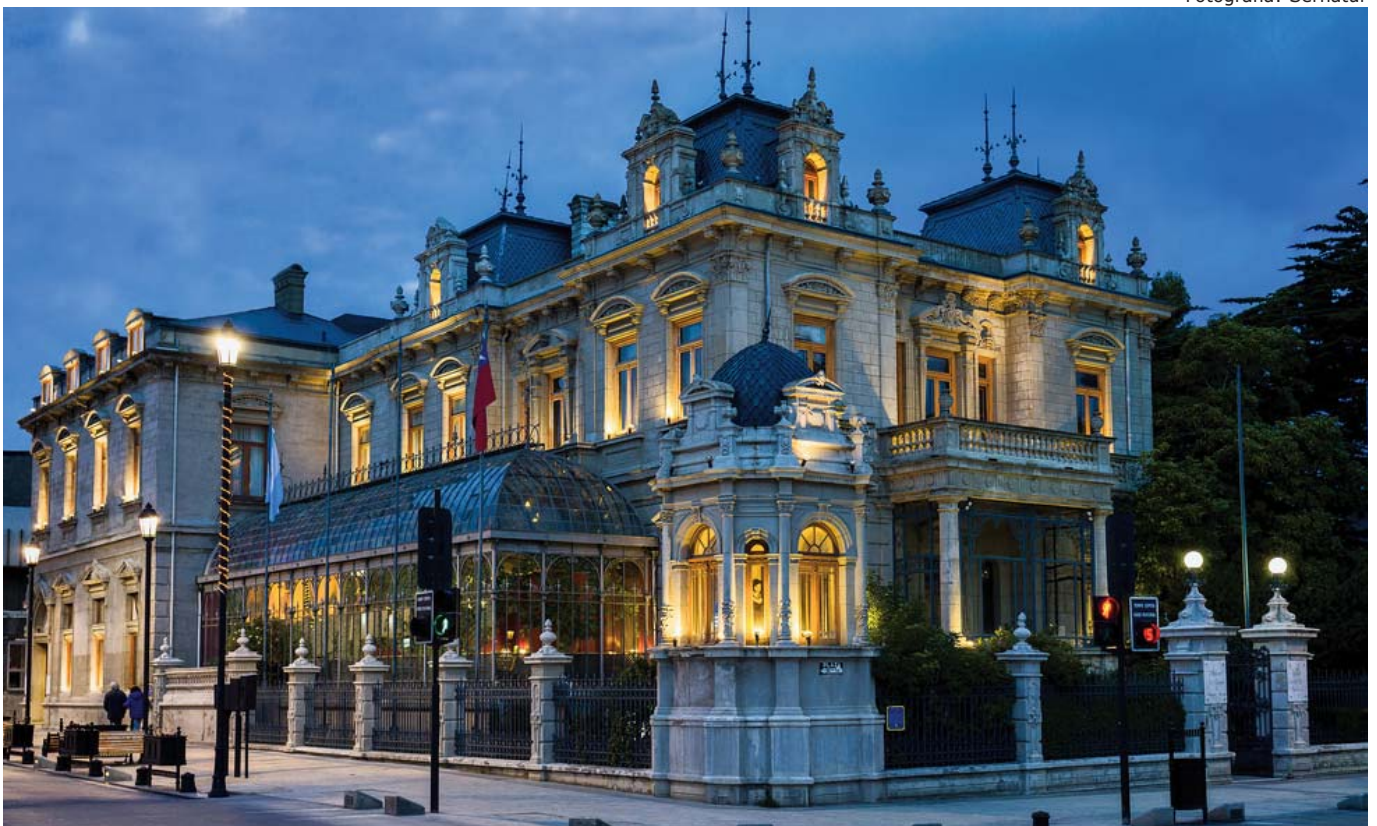
Club de la Unión/Palacio de Sara Braun