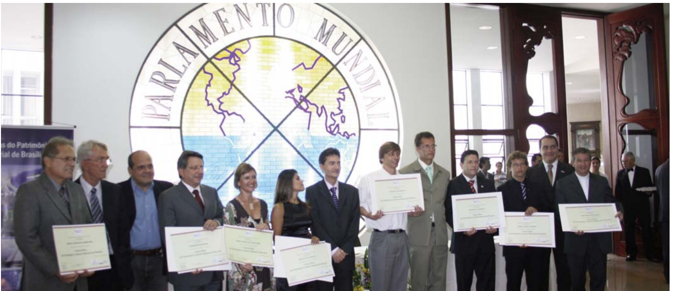
Ceremonia de entrega de los diplomas a los representantes de los tesoros de Brasilia, celebrada en el Templo de Boa Vontade, en presencia de Silvestre Gorgulho, Secretario de Estado de Cultura del Distrito Federal, y diputados y senadores federales de Brasil