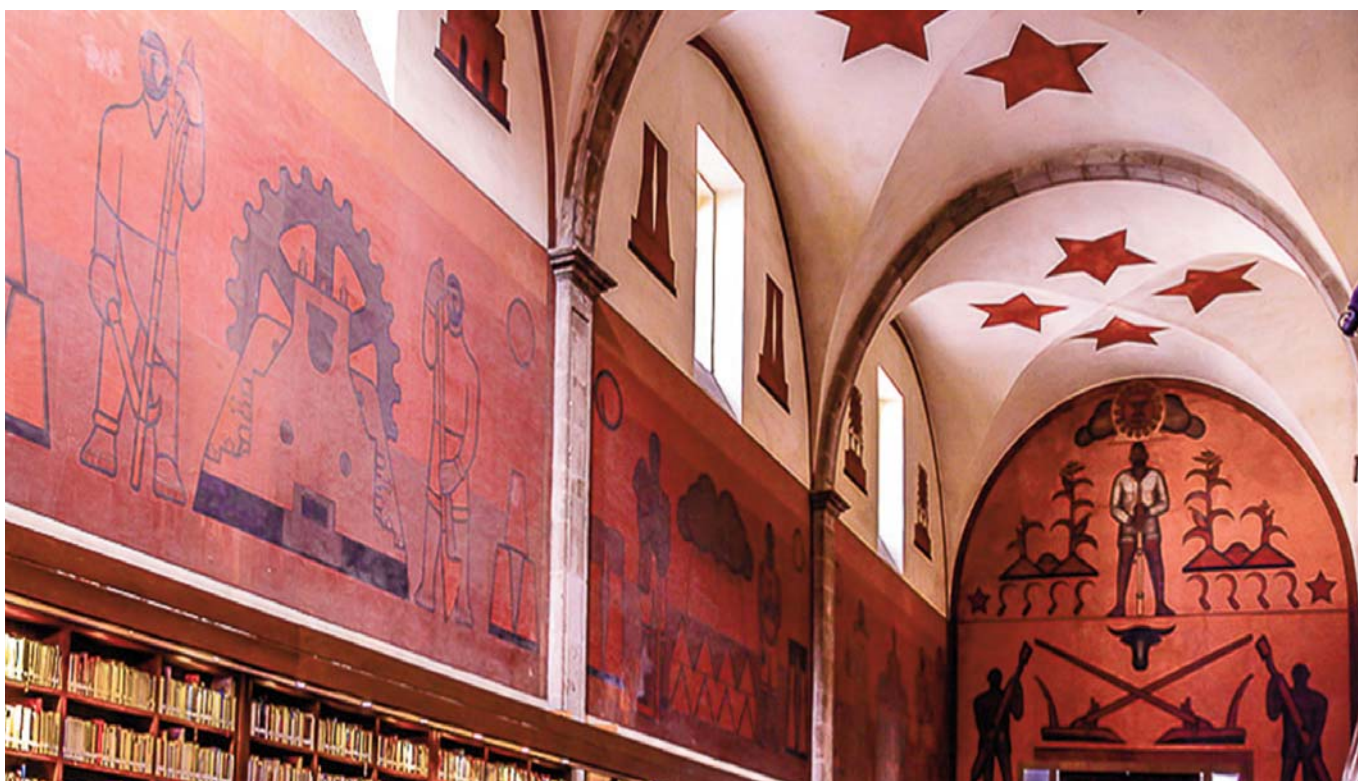
Biblioteca Iberoamericana "Octavio Paz"

Después de diferentes usos, el 1991 se inaugura la Biblioteca Iberoamericana "Octavio Paz" en el marco de la Primera Cumbre iberoamericana.