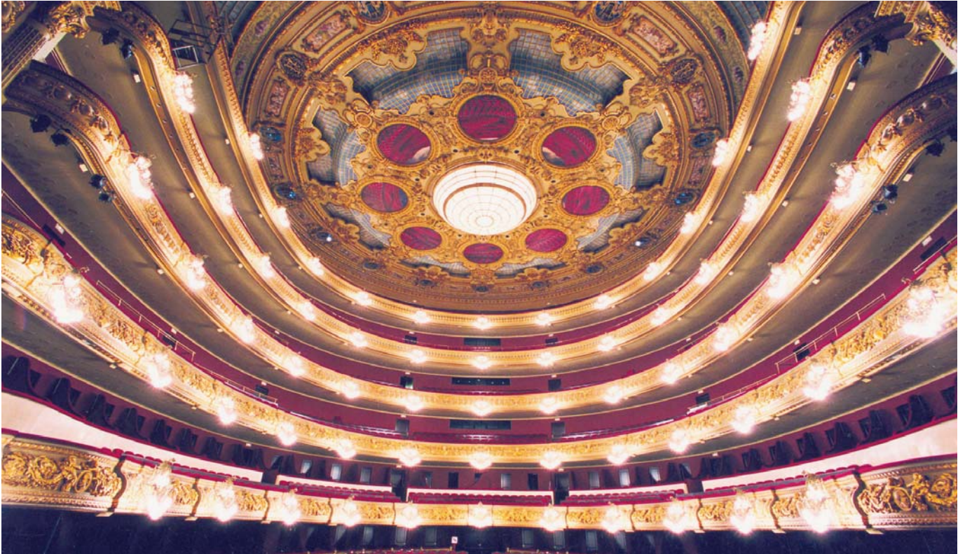
Gran Teatro del Liceo