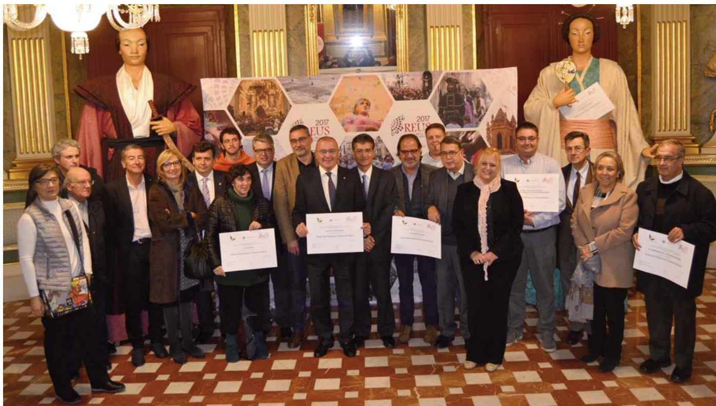
Ceremonia de entrega de los diplomas acreditativos a los representantes de los elementos elegidos como Tesoro del Patrimonio Cultural de Reus, celebrada en el Palacio Bofarull el día 13 de Diciembre de 2016