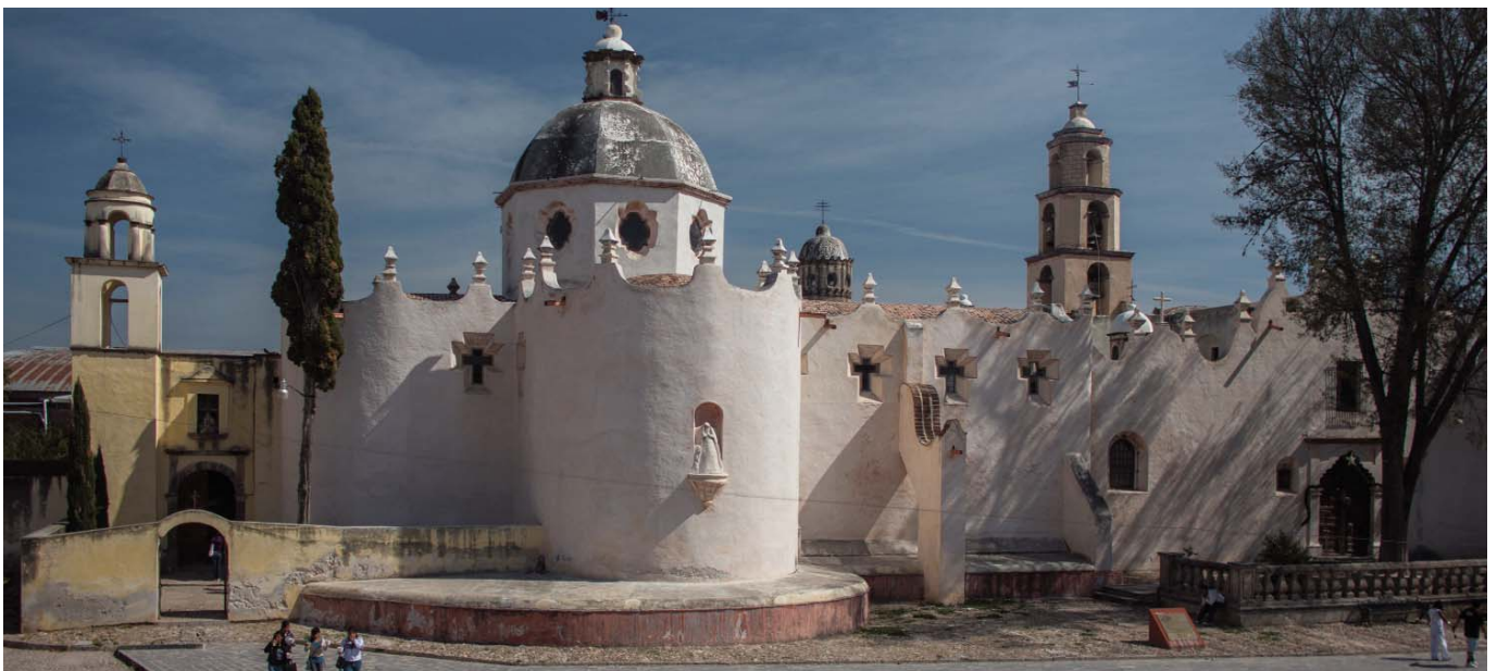
Santuario y Casa de Ejercicios Espirituales de Jesús Nazareno de Atotonilco