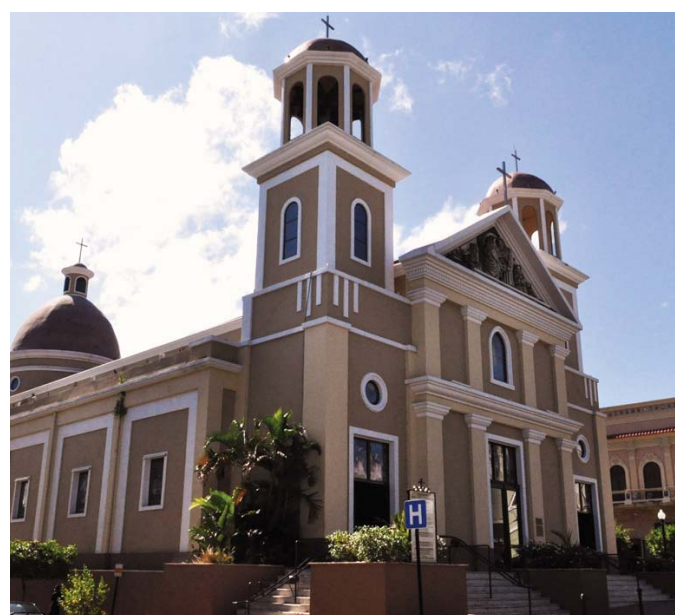
Catedral Nuestra Señora de la Candelaria