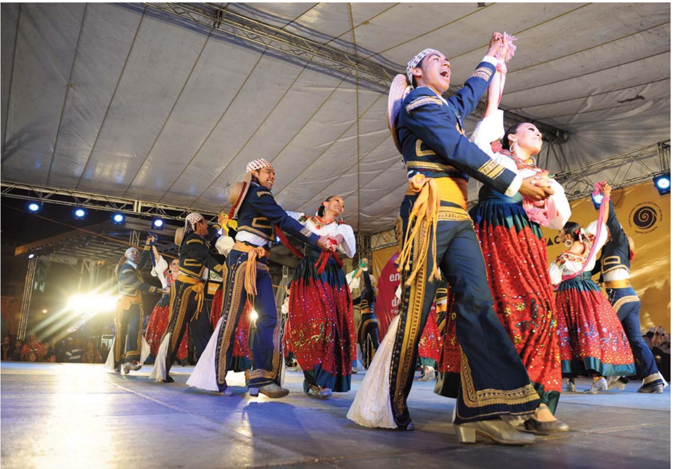
Ballet Folklórico de la Universidad de Colima (México)

El Ballet Folklórico de la Universidad de Colima se ha incorporado a la Lista Representativa de los Tesoros Universitarios del Mundo como uno de los siete tesoros del Patrimonio Cultural de Colima cuando este Estado mexicano fue Capital Americana de la Cultura 2014.