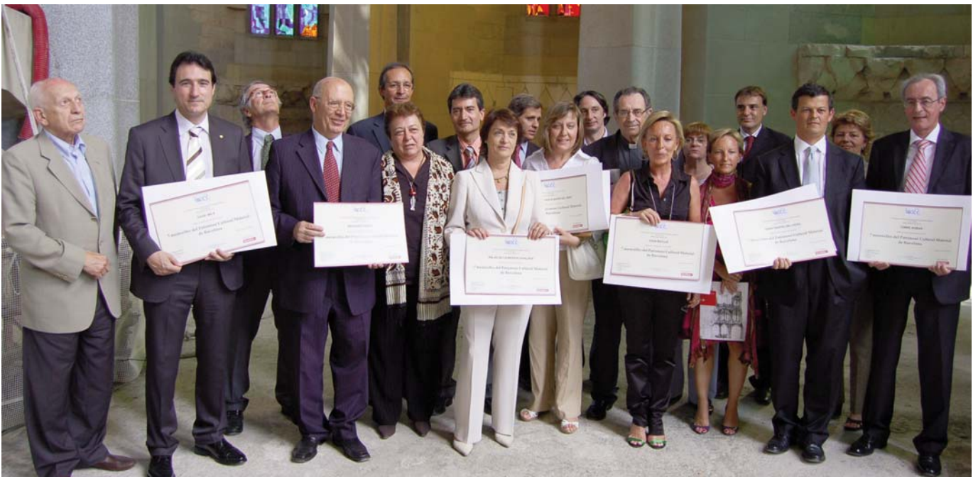
Ceremonia de entrega de los diplomas a los representantes de los tesoros de Barcelona, acto celebrado en el interior del Templo Expiatorio de la Sagrada Familia, en presencia del actual alcalde de Barcelona, Xavier Trias, y varios concejales del Ayuntamiento de Barcelona