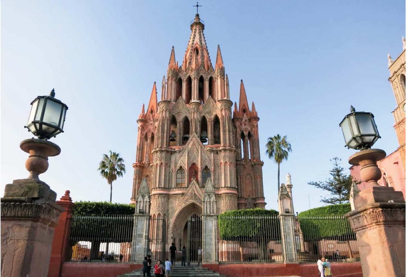
Parroquia de San Miguel Arcángel