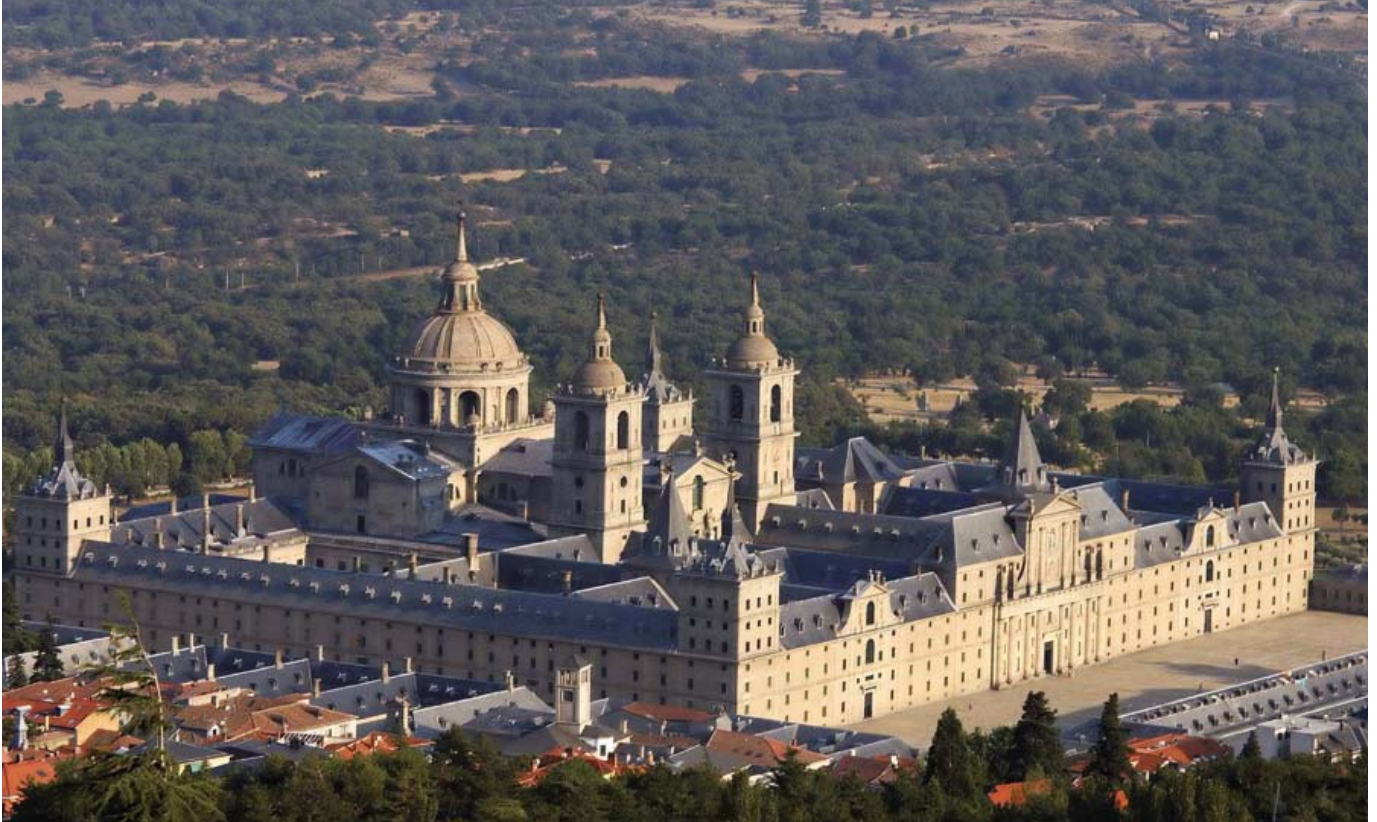
Monasterio y Real Sitio de San Lorenzo del Escorial