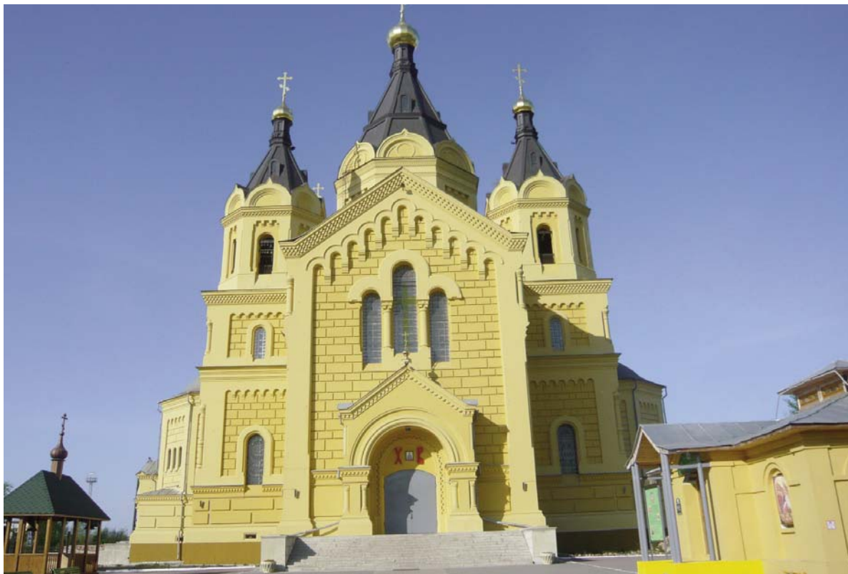
Catedral de San Alejandro del Neva