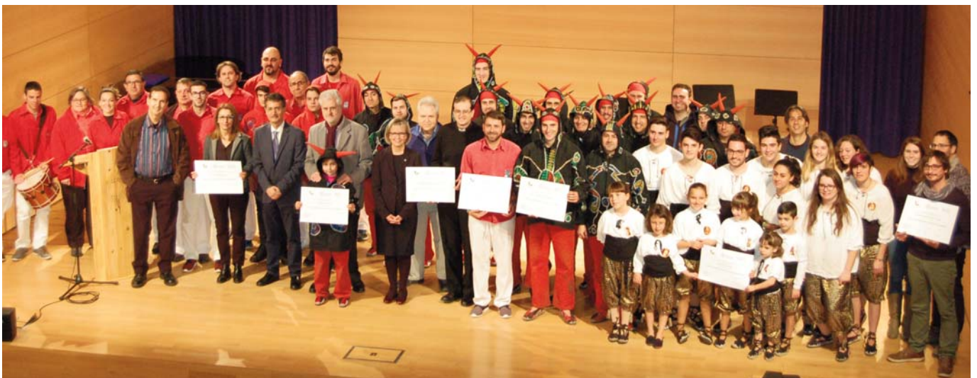
Ceremonia de entrega de reconocimientos a los representantes de los elementos elegidos como 7 Tesoros del Patrimonio Cultural del Vendrell, celebrada el día 14 de Enero de 2017