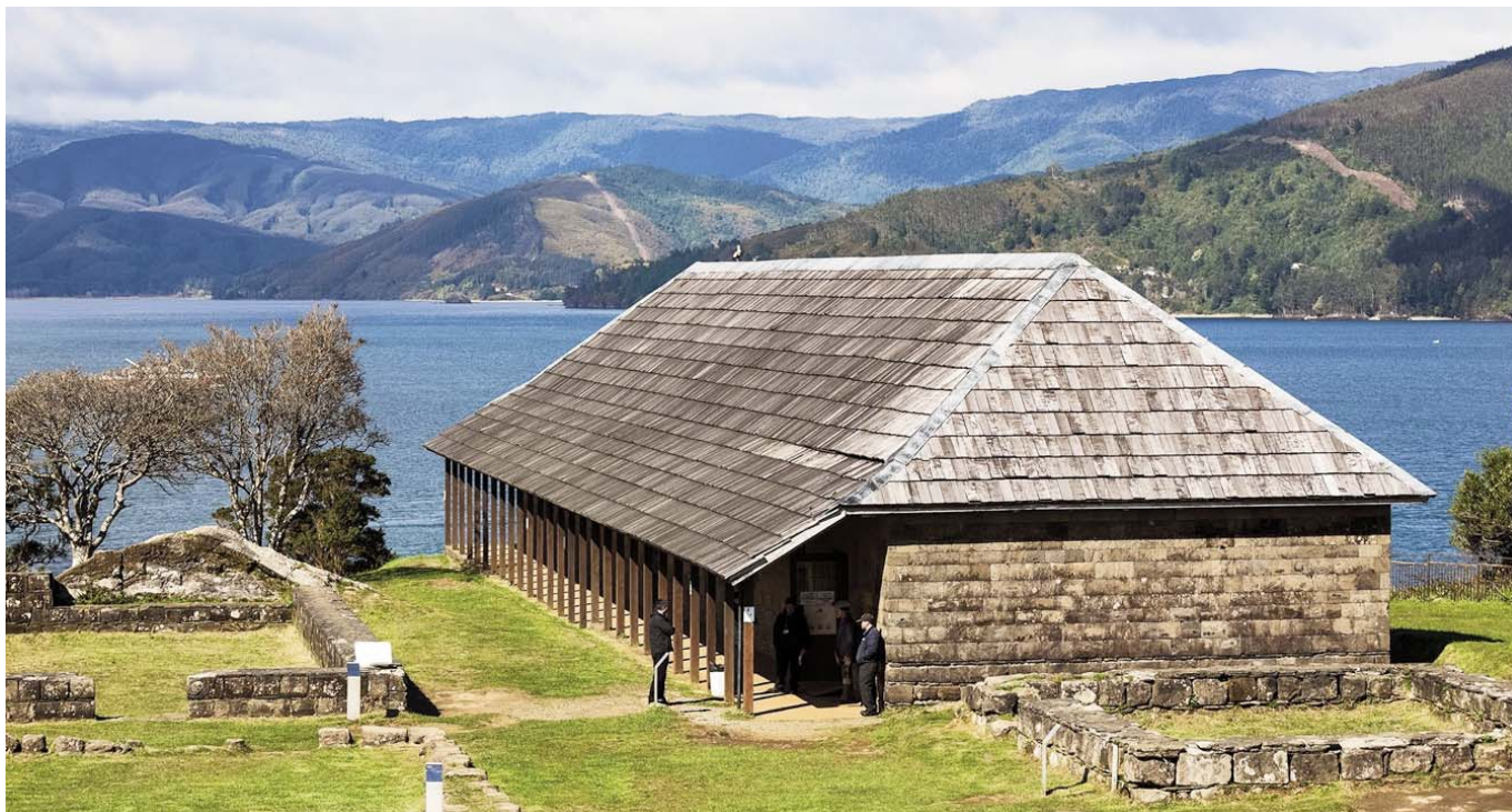
Fuerte de Niebla