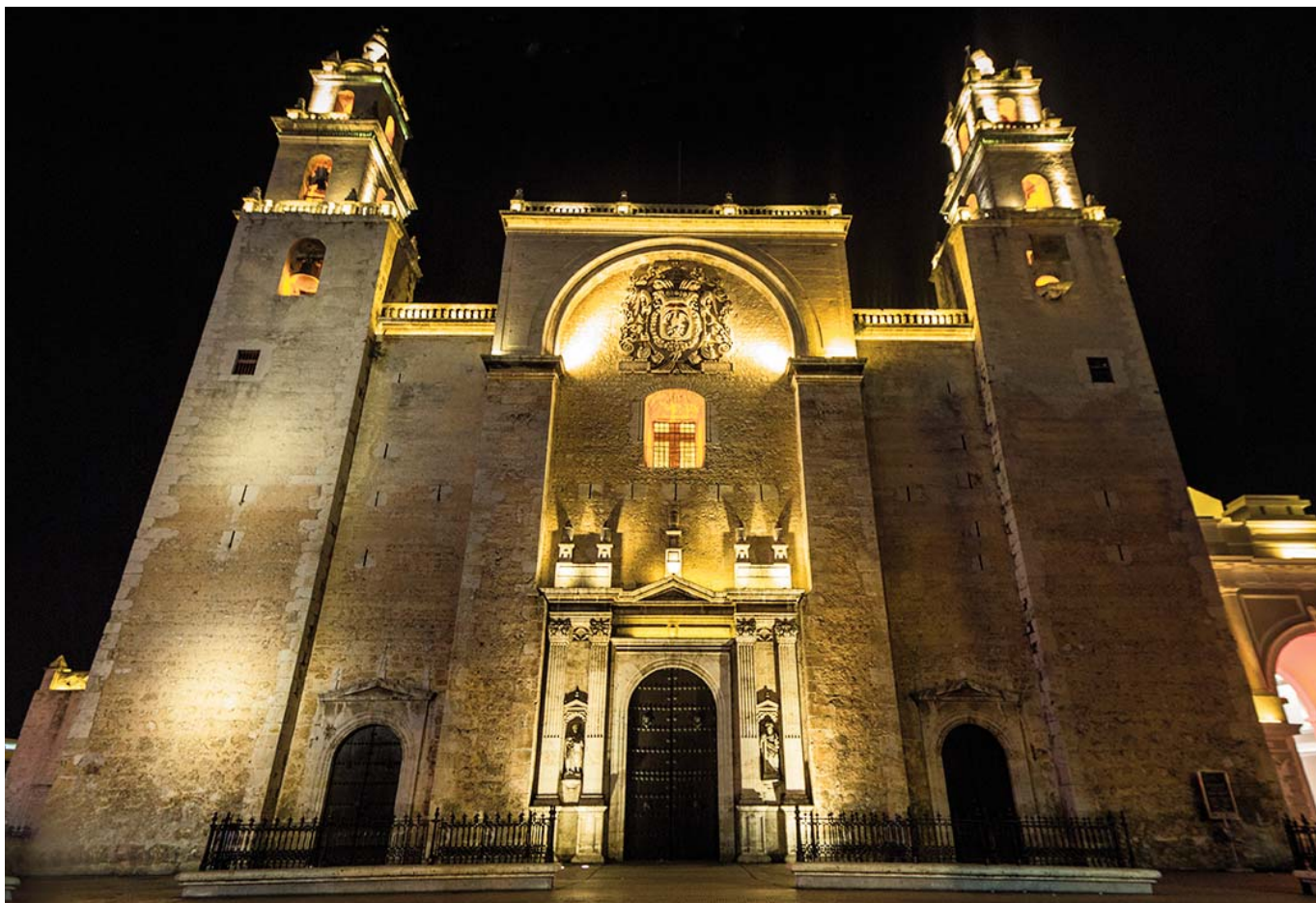
Catedral de Mérida