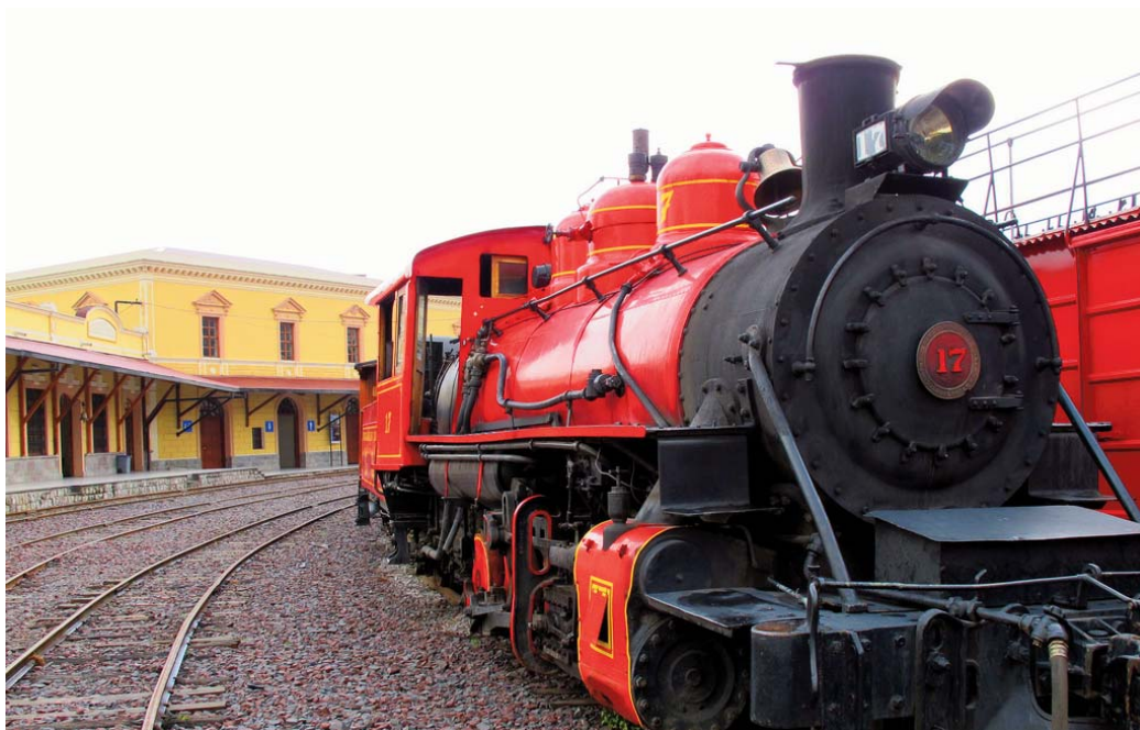
Estación de Ferrocarril Eloy Alfaro