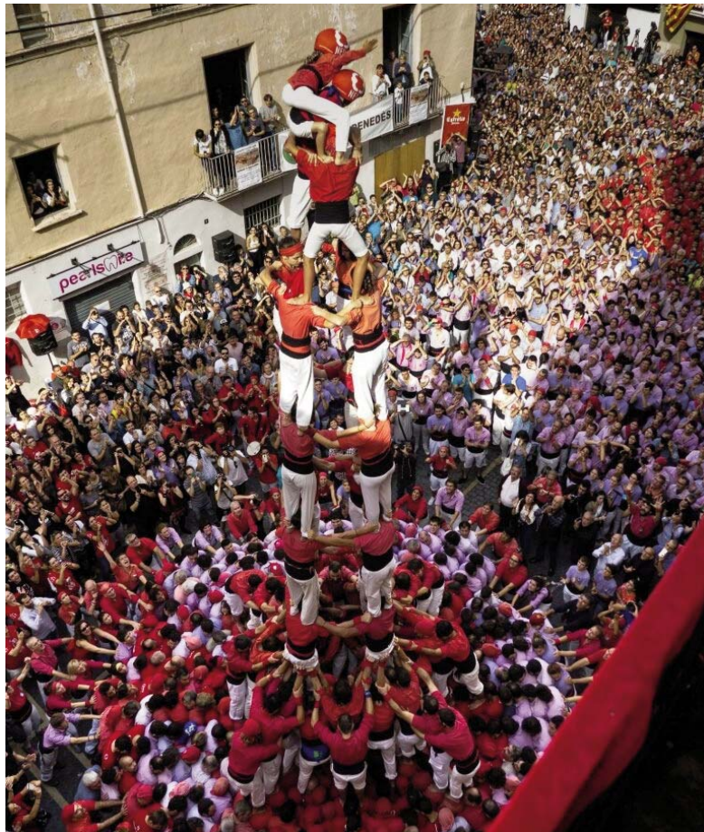
Niños del Vendrell