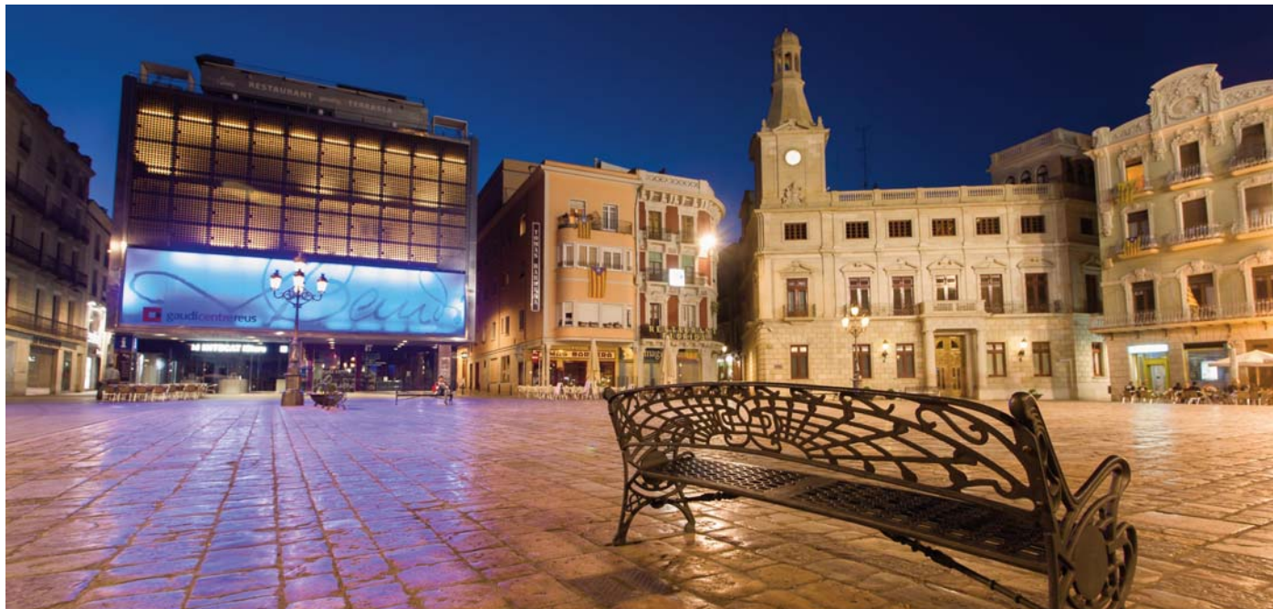
Plaza del Mercadal