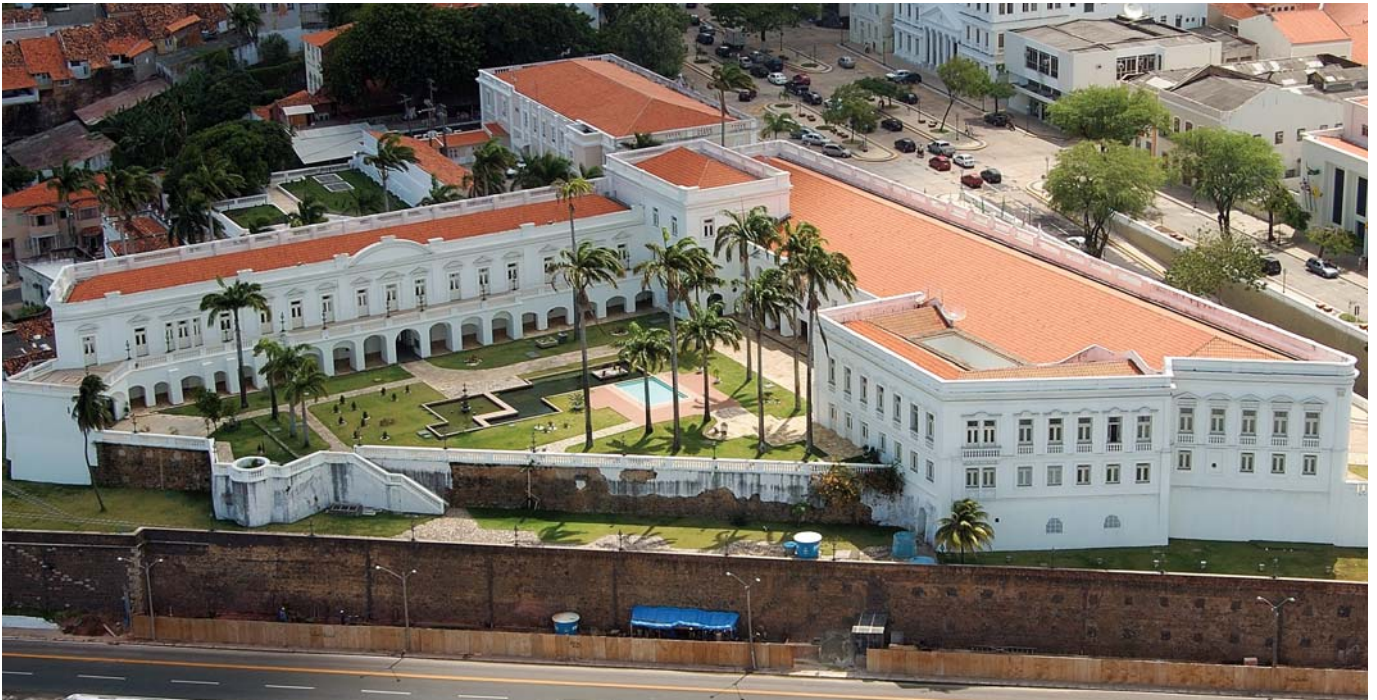
Palacio de los Leones