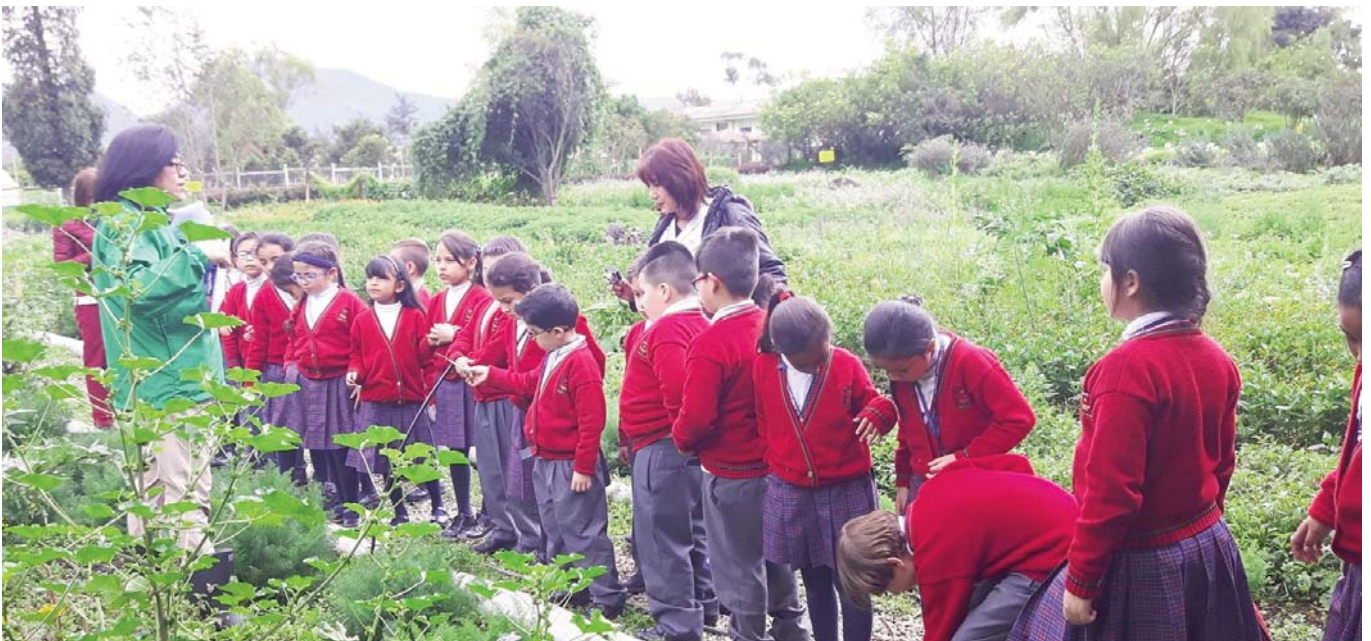
Jardín Medicinal Jorge Piñeros Corpas

La Fundación Universitaria Juan N. Corpas cuenta en su campus con un terreno de nueve mil m 2 donde se encuentra el Jardín Medicinal Jorge Piñeros Corpas, cultivo orgánico certificado, bautizado en homenaje a la obra del fundador y a su preocupación por investigar y aprovechar los recursos naturales del país y las bondades de la flora medicinal colombiana, con criterio de sostenibilidad y beneficio social. El jardín, que forma parte de una Reserva Forestal Ambiental, alberga un ecosistema conformado por diferentes especies de mariposas, aves, mamíferos pequeños y anfibios que prestan servicios ambientales de gran importancia tales como control biológico de plagas, polinización y dispersión de semillas. Para la Fundación Universitaria es este un escenario único para contribuir al desarrollo de la conciencia ecológica y de sostenibilidad ambiental en escolares, universitarios y la comunidad en general.