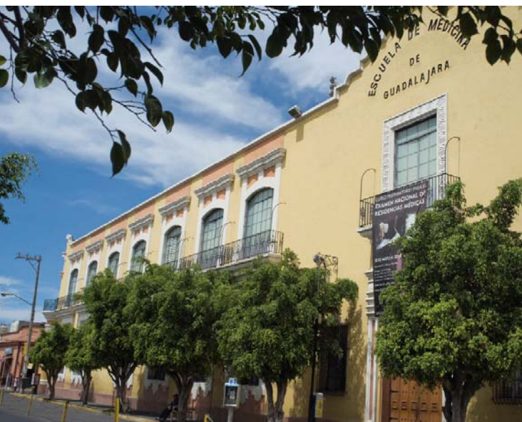
Antigua Facultad de Medicina