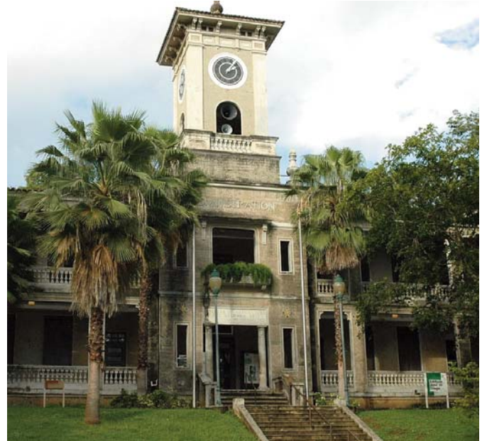
Recinto Universitario de Mayagüez