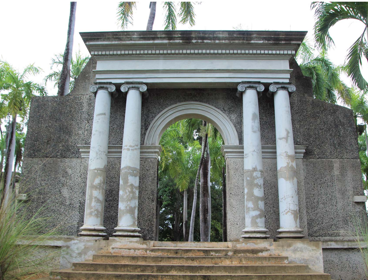
Pórtico histórico del Recinto Universitario de Mayagüez

En 1918 un terremoto destruyó parcialmente la ciudad de Mayagüez y un fuego causaron daños significativos a la institución universitaria. Las ruinas de la entrada de uno de los edificios que resistió la devastación pasaría luego a convertirse en el emblema de la institución. En 1988 estas ruinas (El Pórtico) fueron recreadas en un monumento.