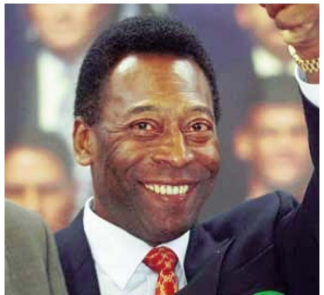
Edson Arantes do Nascimento "Pelé"