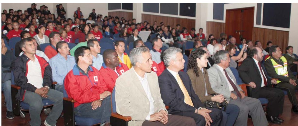
La presentación de la campaña 5 partidos de fútbol jugados en Quito Patrimonio Deportivo Histórico de la Humanidad despertó una gran expectación.