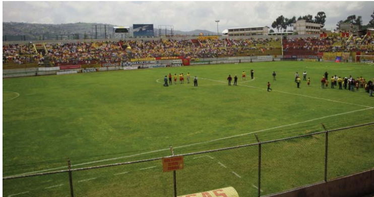
Estadio Gonzalo Pozo donde juega la Sociedad Deportiva Aucas.

Su uniforme titular es camiseta amarilla con detalles rojos, pantalón roja, medias grises.