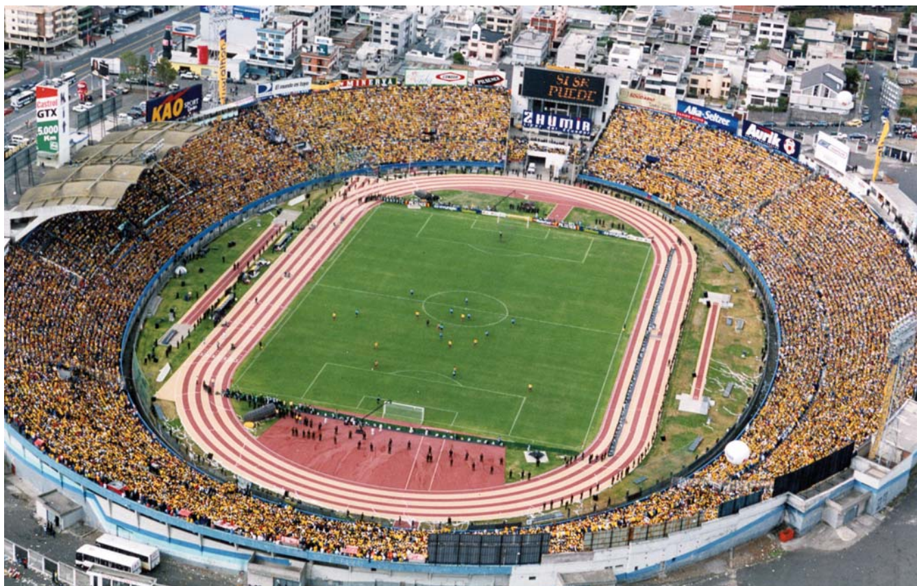
Estadio Olímpico Atahualpa, donde juegan, entre otros, el Deportivo Quito, El Nacional y la Selección Nacional de Ecuador.

El recordado "clásico de la neblina" generó una gran conmoción social. 50 mil personas accedieron al estadio Atahualpa y 15 mil se quedaron fuera. La neblina impidió que los aficionados pudieran observar al menos dos de los cuatro goles marcados.