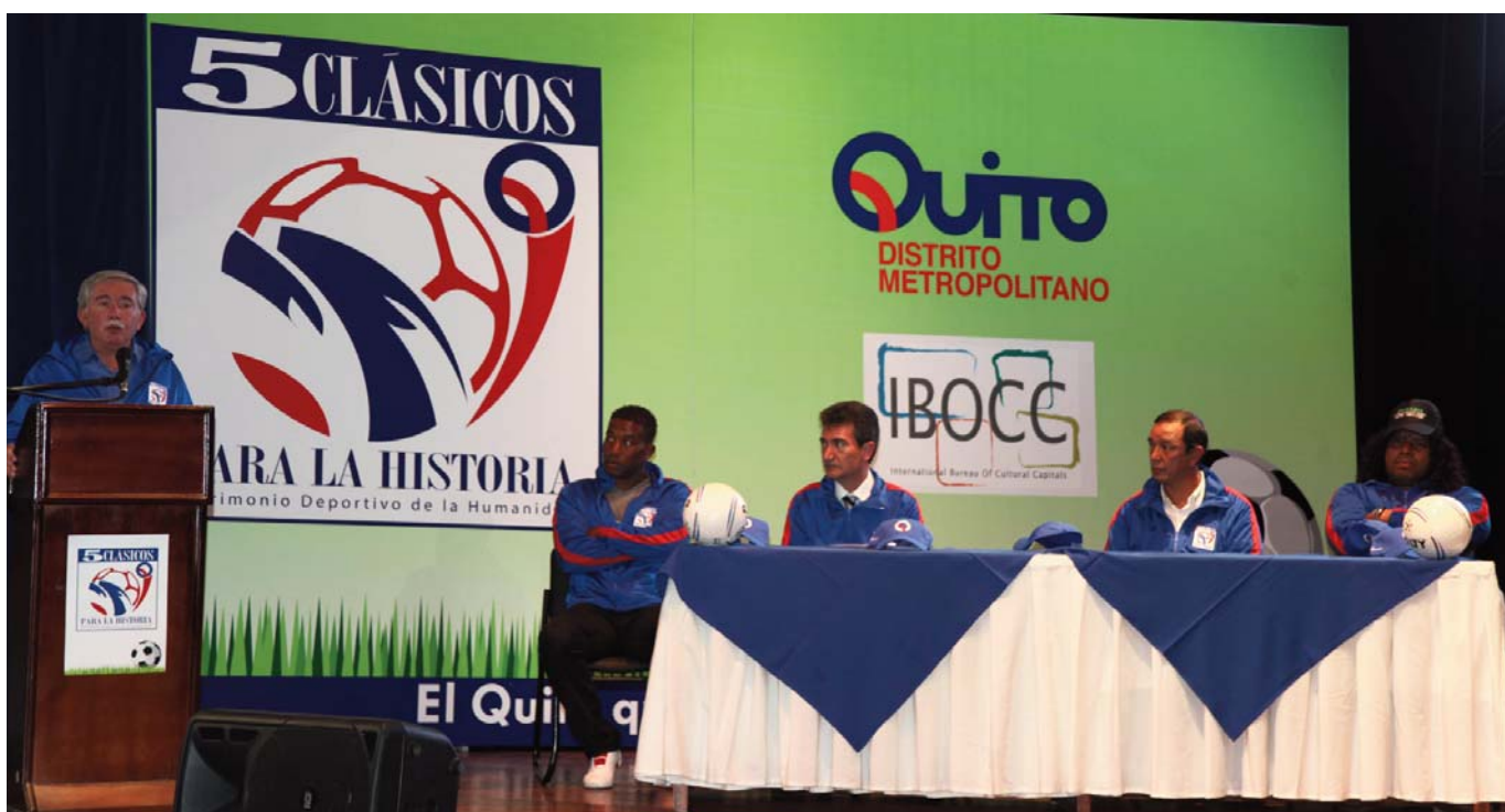
Presentación de la campaña 5 partidos jugados en Quito Patrimonio de la Humanidad el día 17 de febrero de 2012.

Hay que destacar también al equipo Independiente del Valle (1958) que juega en Sangolquí, ciudad cercano a Quito, capital del cantón Rumiñahui en la provincia de Pichincha. Se desempeña en la Serie A de Ecuador. Este equipo dispone de una Escuela de Fútbol a la que asisten más de un centenar de jóvenes de todo Ecuador que se forman en la práctica deportiva pero también en los estudios regulares correspondientes a su edad.