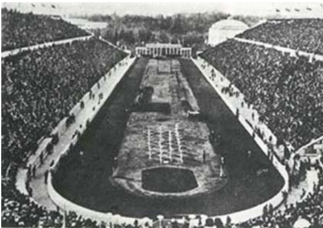
Juegos Olímpicos de Atenas 1896.

Esta Lista representativa del Patrimonio Deportivo Histórico de la Humanidad , de características similares a las que ya existen en los ámbitos del patrimonio cultural material, inmaterial o natural de la humanidad, pretende impulsar la consolidación de la importancia de la preservación de los valores de la realidad deportiva en todo el mundo. El primer deporte que se incorpora a esta Lista es el fútbol.