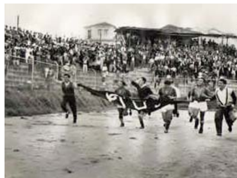
Imágenes históricas del estadio El Ejido, también conocido popularmente como "El Arbolito" (1932-1966) el más antiguo, legendario y tradicional de la ciudad.