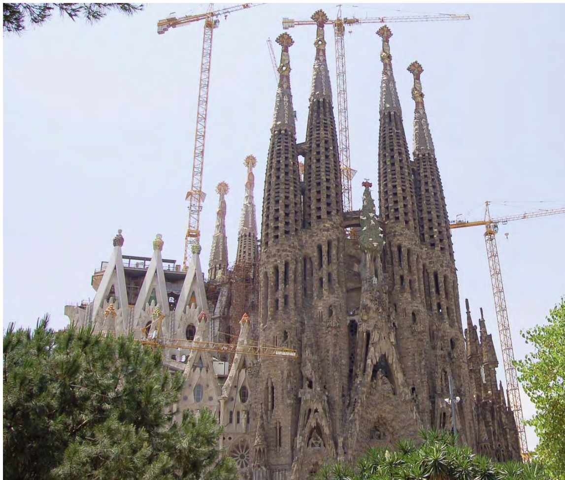
Templo Expiatorio de la Sagrada Familia de Barcelona