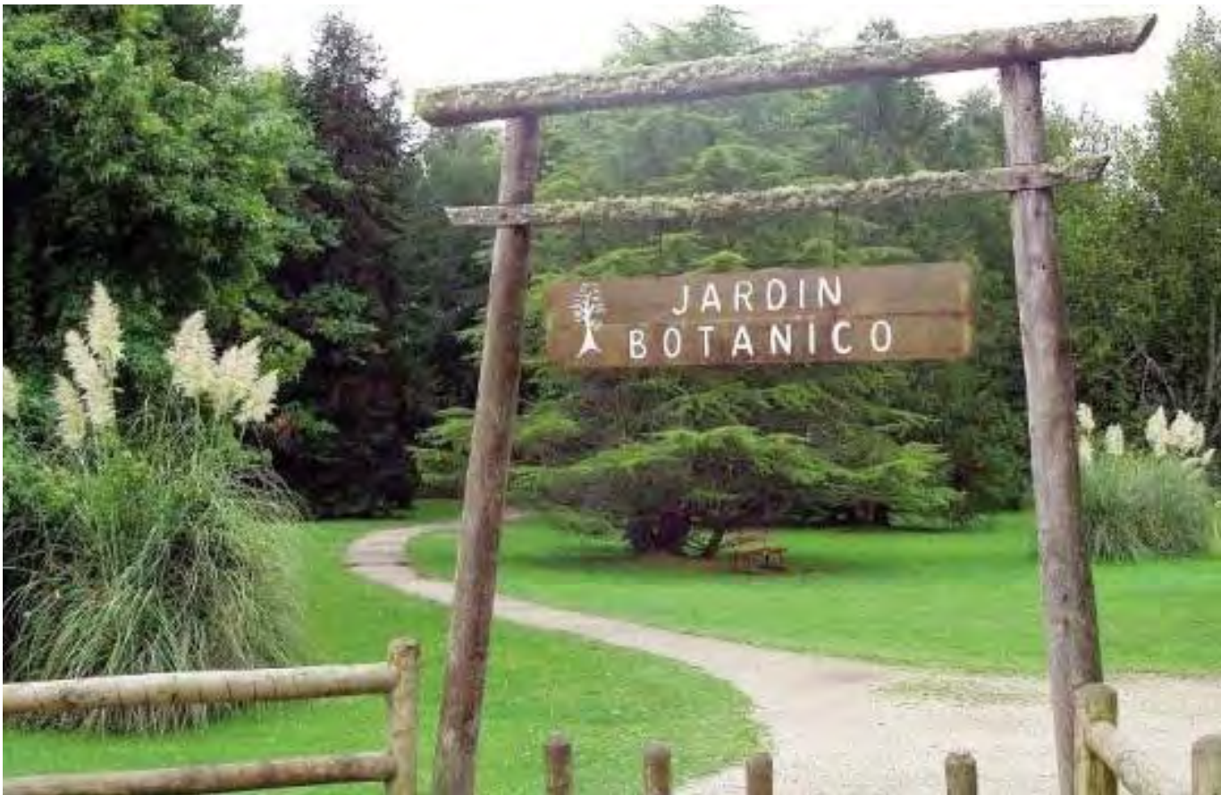
Jardín Botánico de la Universidad Austral de Chile en Valdivia

Actualmente el Jardín se encuentra en una etapa de modernización que tiene por objetivo transformarlo en un centro de investigación, educación y cultura.