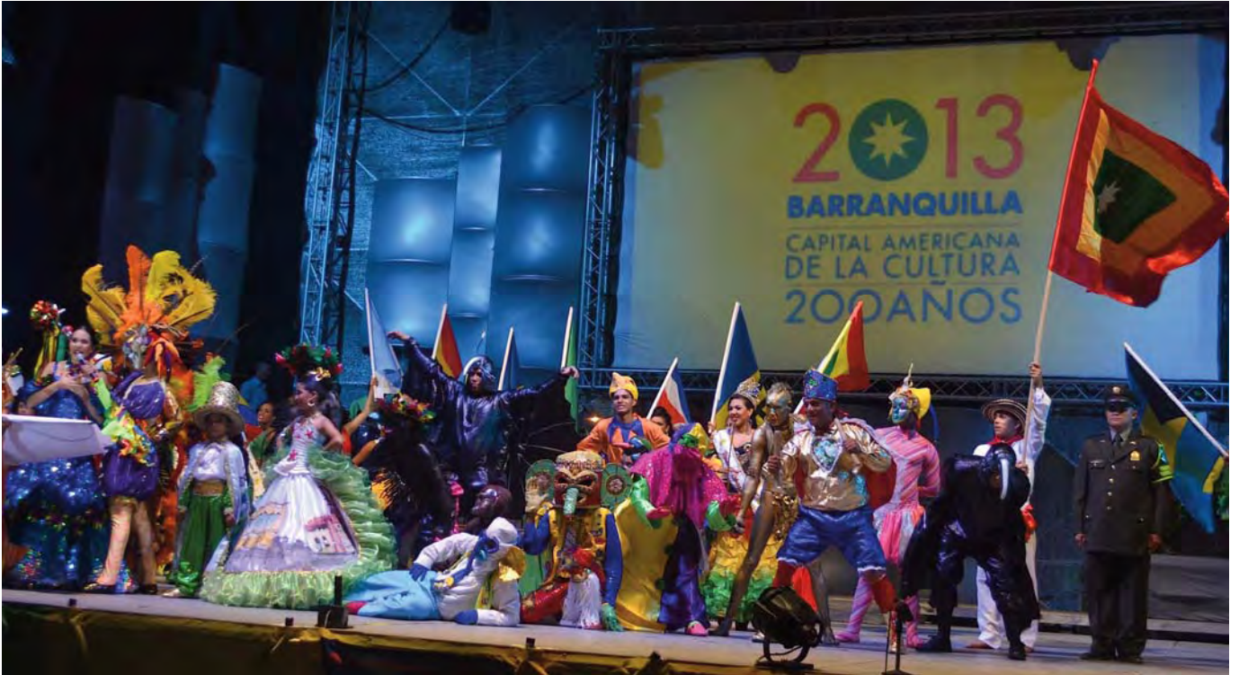
Carnaval de Barranquilla