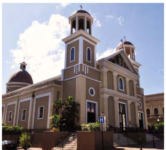
Catedral Nuestra Señora de la Candelaria