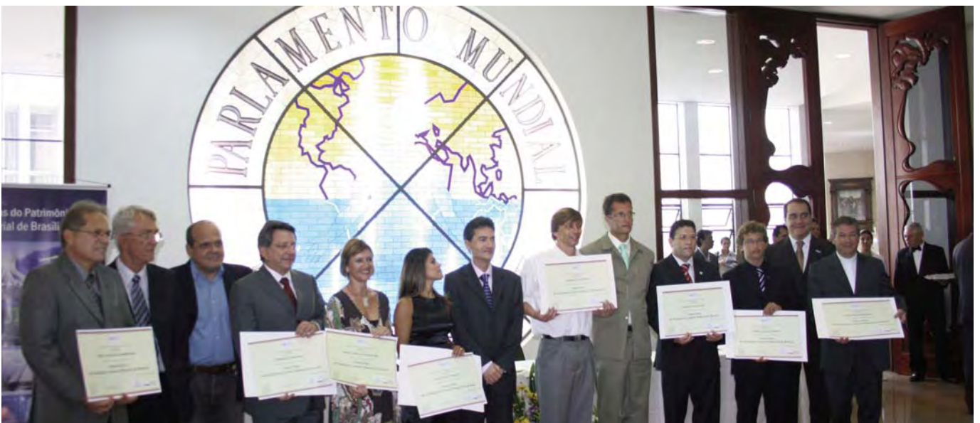
Ceremonia de entrega de los diplomas a los representantes de los tesoros de Brasilia, celebrada en el Templo de Boa Vontade, en presencia de Silvestre Gorgulho, Secretario de Estado de Cultura del Distrito Federal, y diputados y senadores federales de Brasil