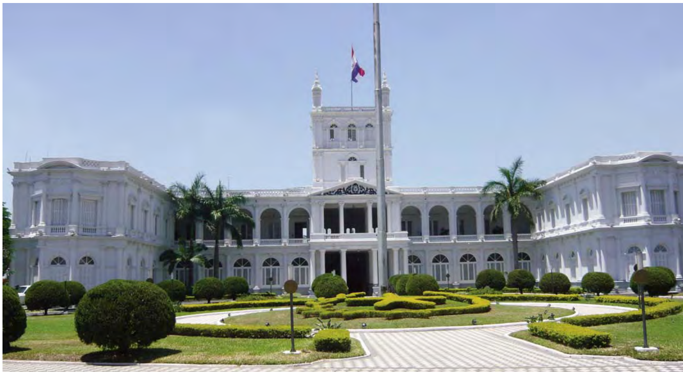
Palacio de los López