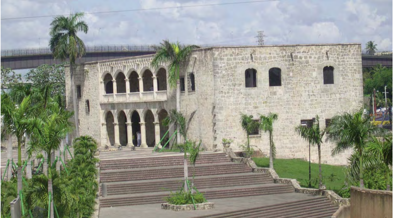
Alcázar de Colón