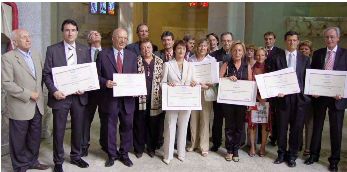
Ceremonia de entrega de los diplomas a los representantes de los tesoros de Barcelona, acto celebrado en el interior del Templo Expiatorio de la Sagrada Familia, en presencia del actual alcalde de Barcelona, Xavier Trias, y varios concejales del Ayuntamiento de Barcelona