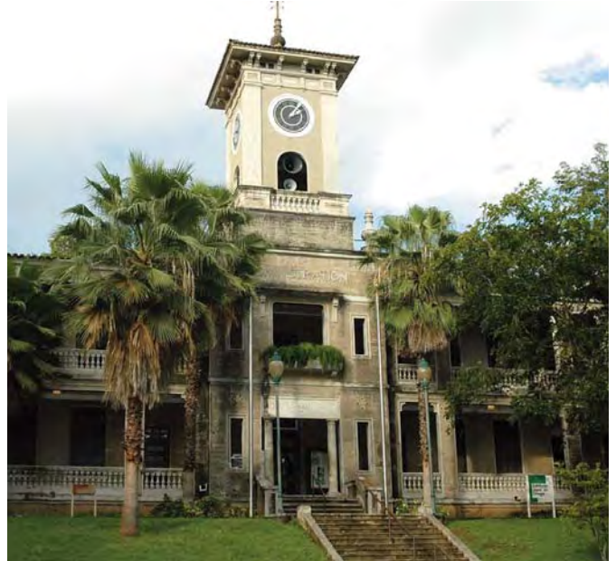
Recinto Universitario de Mayagüez