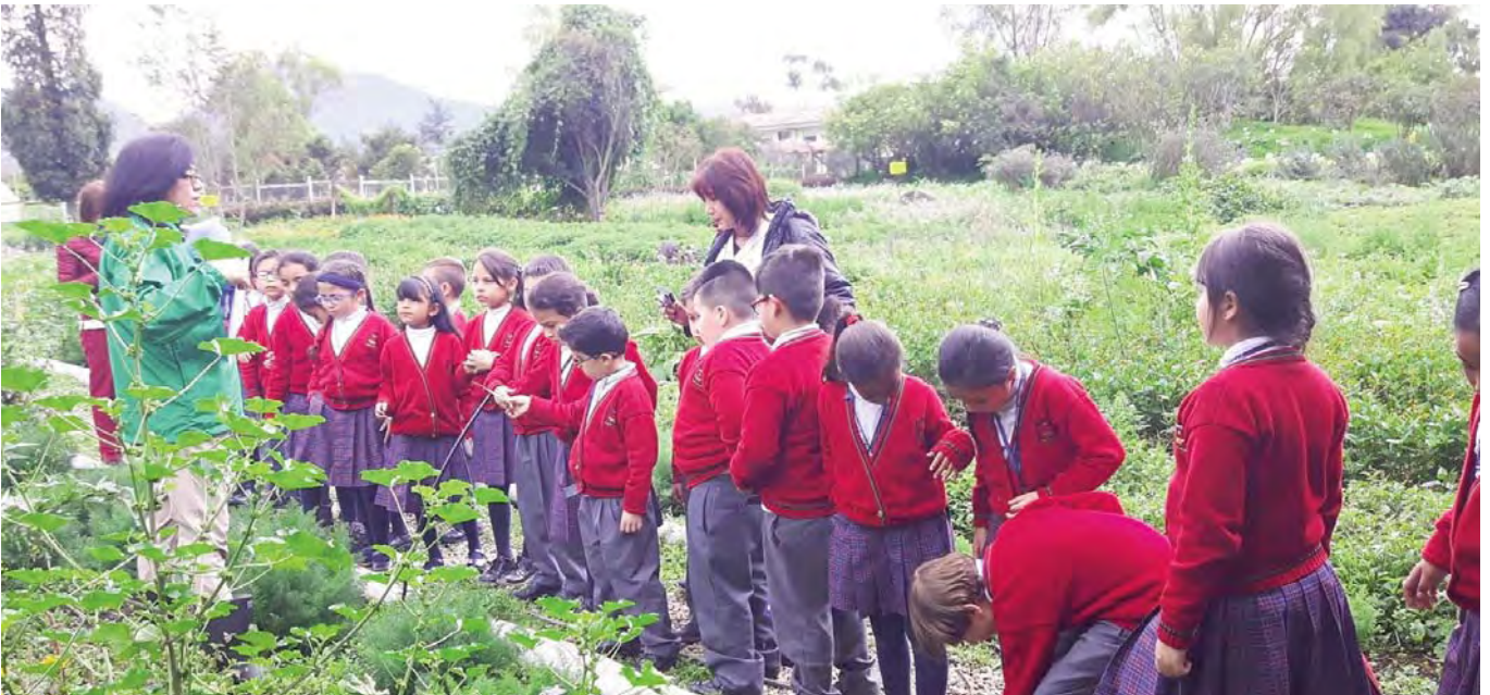
Jardín Medicinal Jorge Piñeros Corpas

La Fundación Universitaria Juan N. Corpas cuenta en su campus con un terreno de nueve mil m 2 donde se encuentra el Jardín Medicinal Jorge Piñeros Corpas, cultivo orgánico certificado, bautizado en homenaje a la obra del fundador y a su preocupación por investigar y aprovechar los recursos naturales del país y las bondades de la flora medicinal colombiana, con criterio de sostenibilidad y beneficio social. El jardín, que forma parte de una Reserva Forestal Ambiental, alberga un ecosistema conformado por diferentes especies de mariposas, aves, mamíferos pequeños y anfibios que prestan servicios ambientales de gran importancia tales como control biológico de plagas, polinización y dispersión de semillas. Para la Fundación Universitaria es este un escenario único para contribuir al desarrollo de la conciencia ecológica y de sostenibilidad ambiental en escolares, universitarios y la comunidad en general.