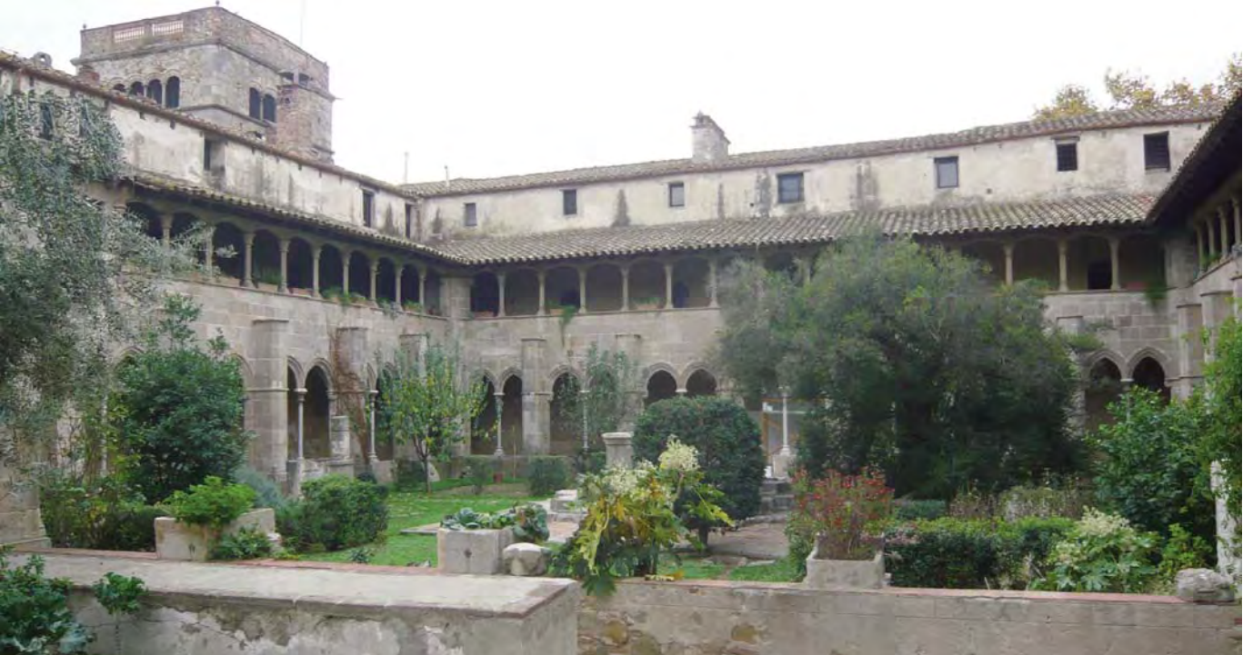
Monasterio de Sant Jeroni de la Murtra