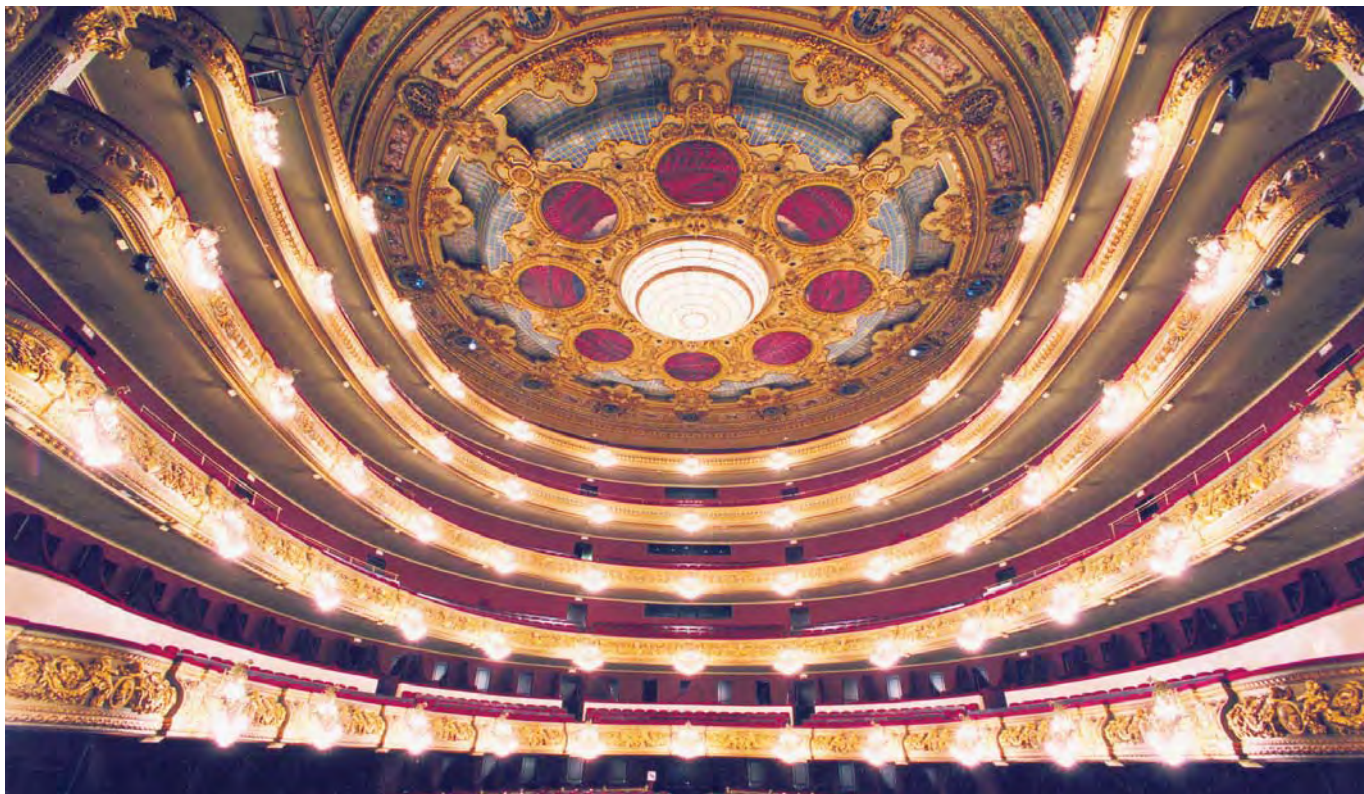
Gran Teatre del Liceo