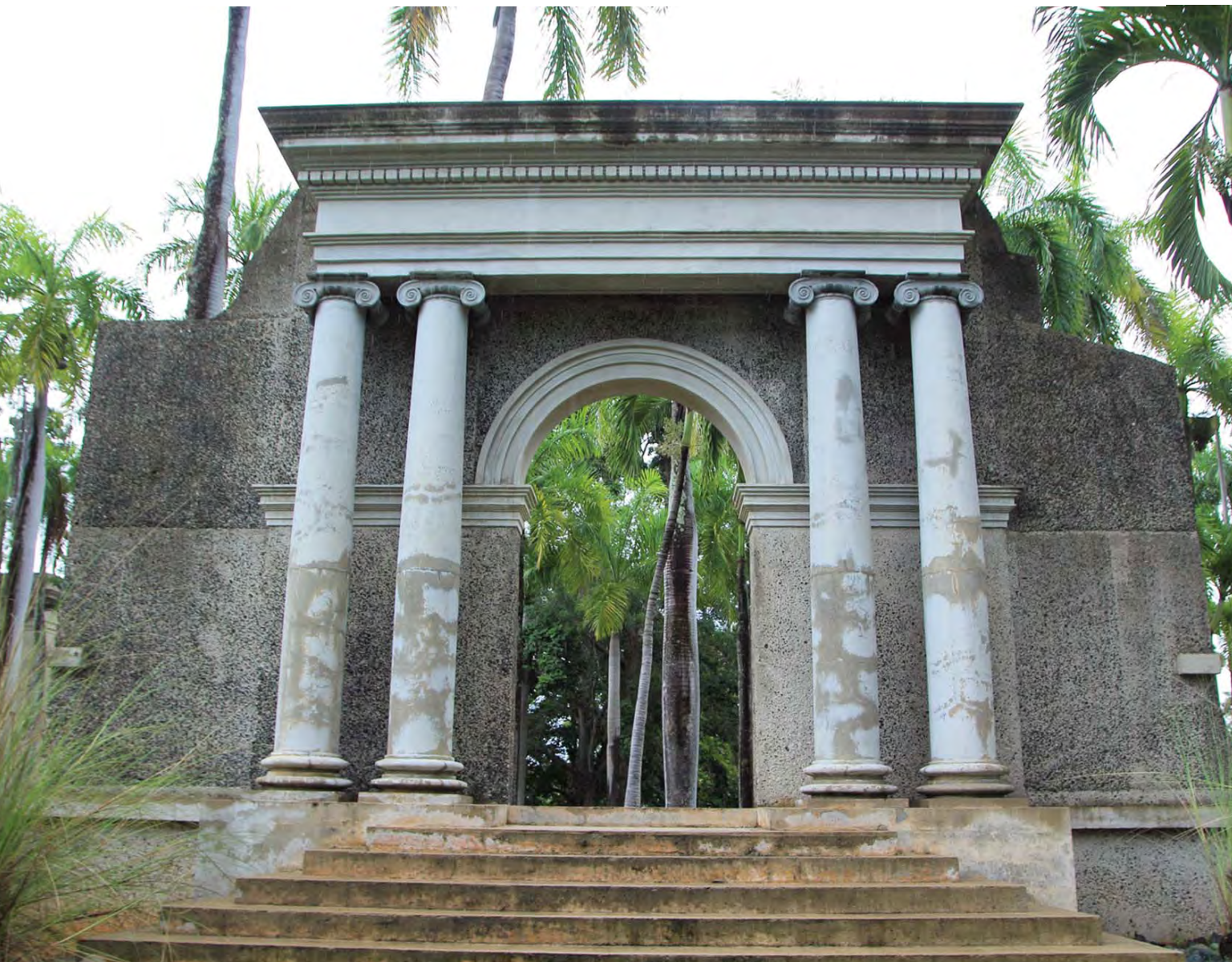
Pórtico histórico del Recinto Universitario de Mayagüez

En 1918 un terremoto destruyó parcialmente la ciudad de Mayagüez y un fuego causaron daños significativos a la institución universitaria. Las ruinas de la entrada de uno de los edificios que resistió la devastación pasaría luego a convertirse en el emblema de la institución. En 1988 estas ruinas (El Pórtico) fueron recreadas en un monumento.