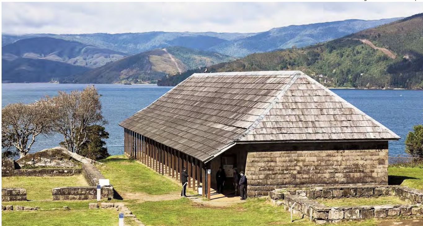
Fuerte de Niebla