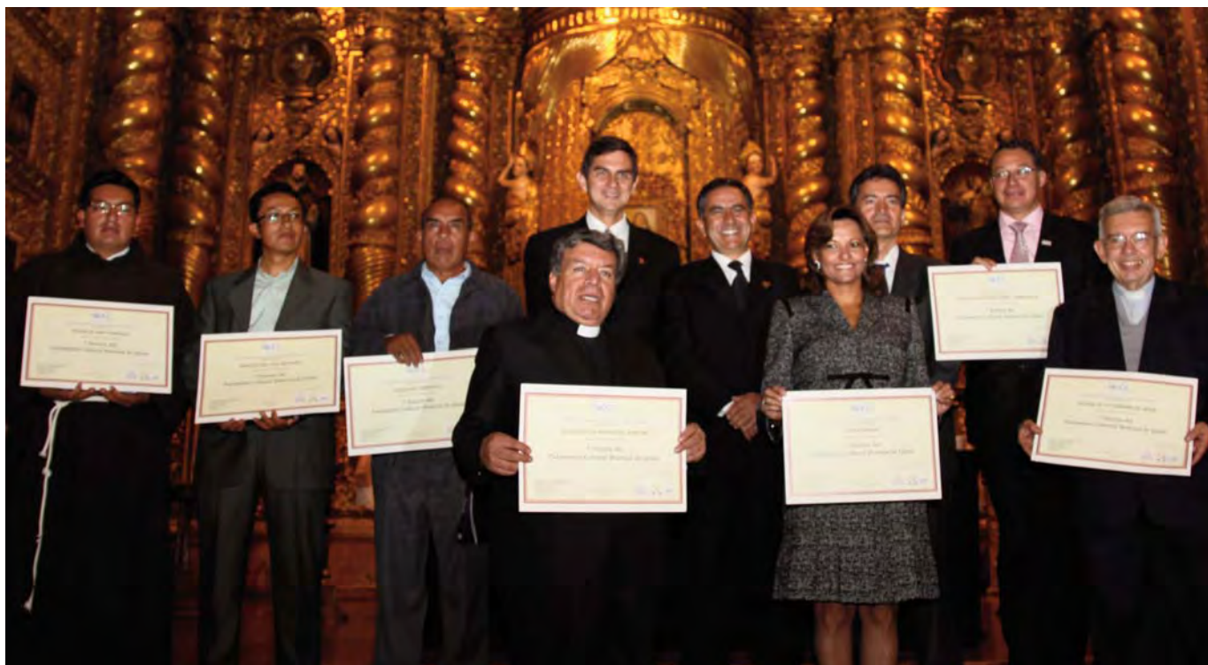
Augusto Barrera, Alcalde del Distrito Metropolitano de Quito, y Xavier Tudela, Presidente del Bureau Internacional de Capitales Culturales, con los representantes de los elementos elegidos Tesoros del Patrimonio Cultural de Quito. La ceremonia se celebró en la Iglesia de la Compañía de Jesús