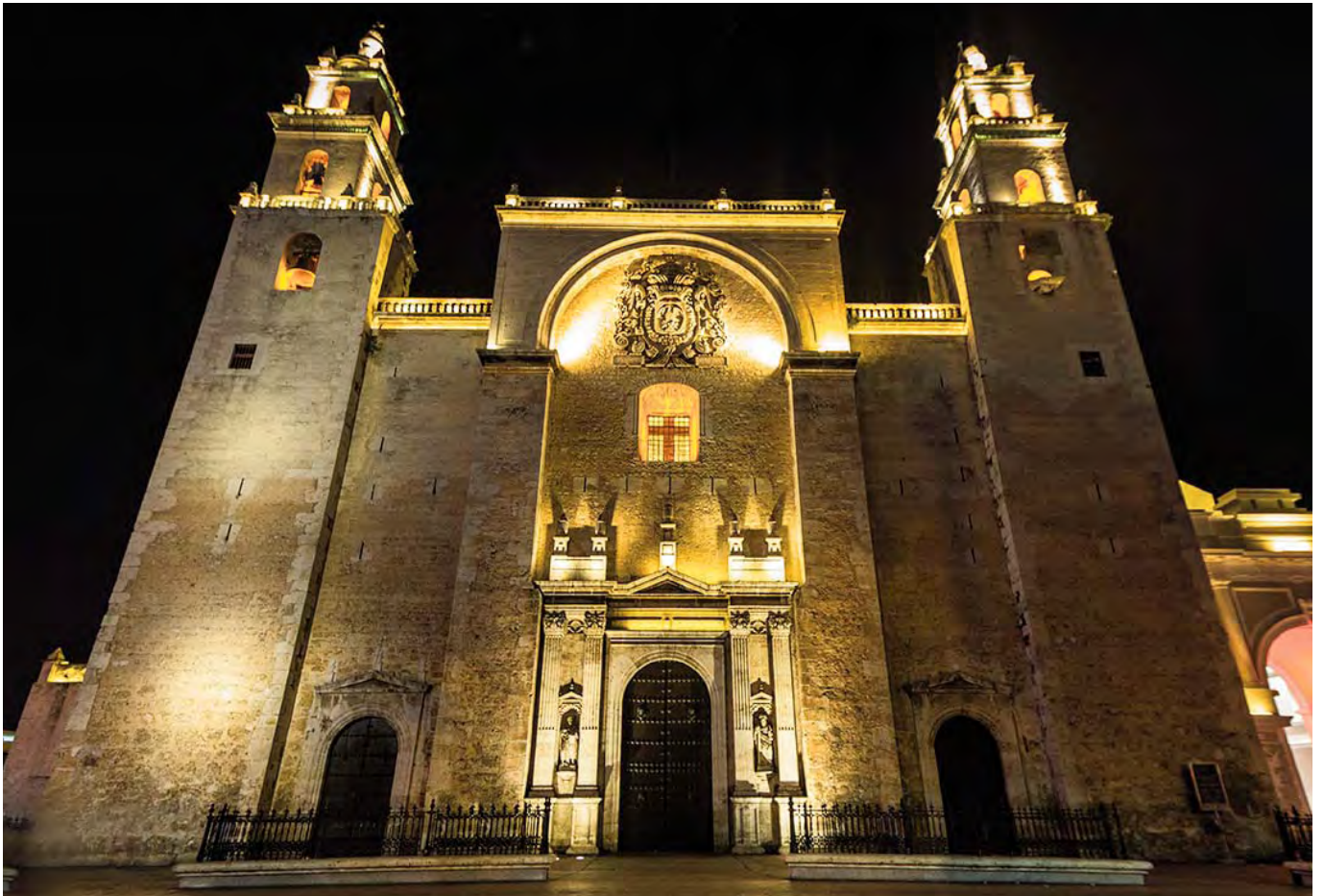
Catedral de Mérida