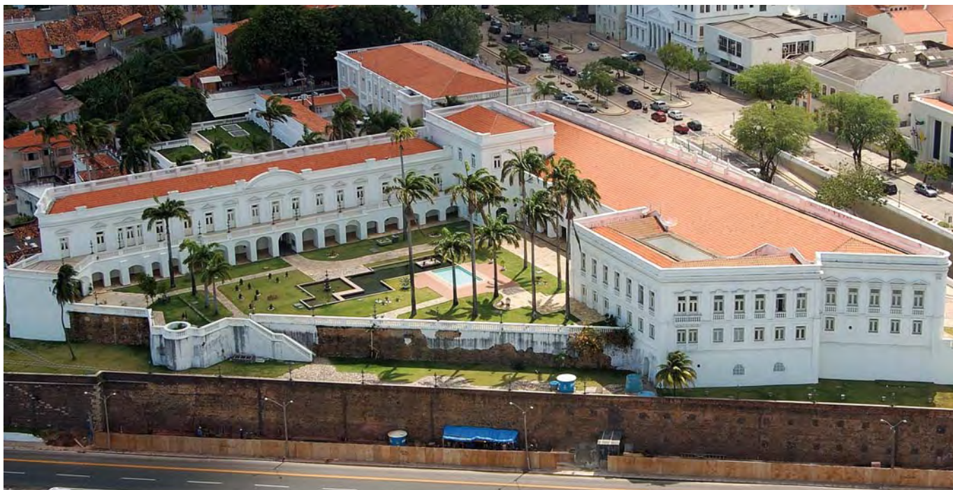
Palacio de los Leones