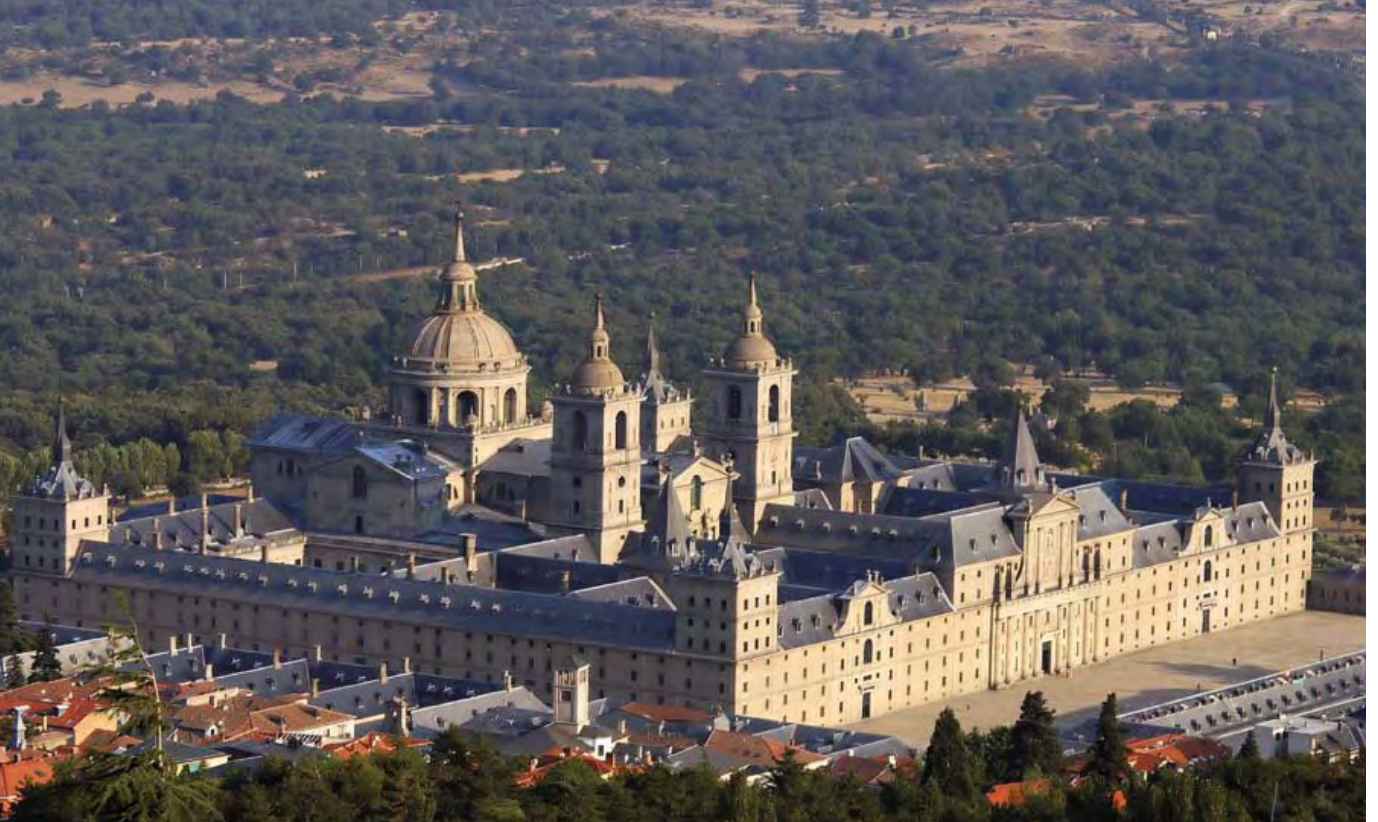
Monasterio y Real Sitio de San Lorenzo del Escorial