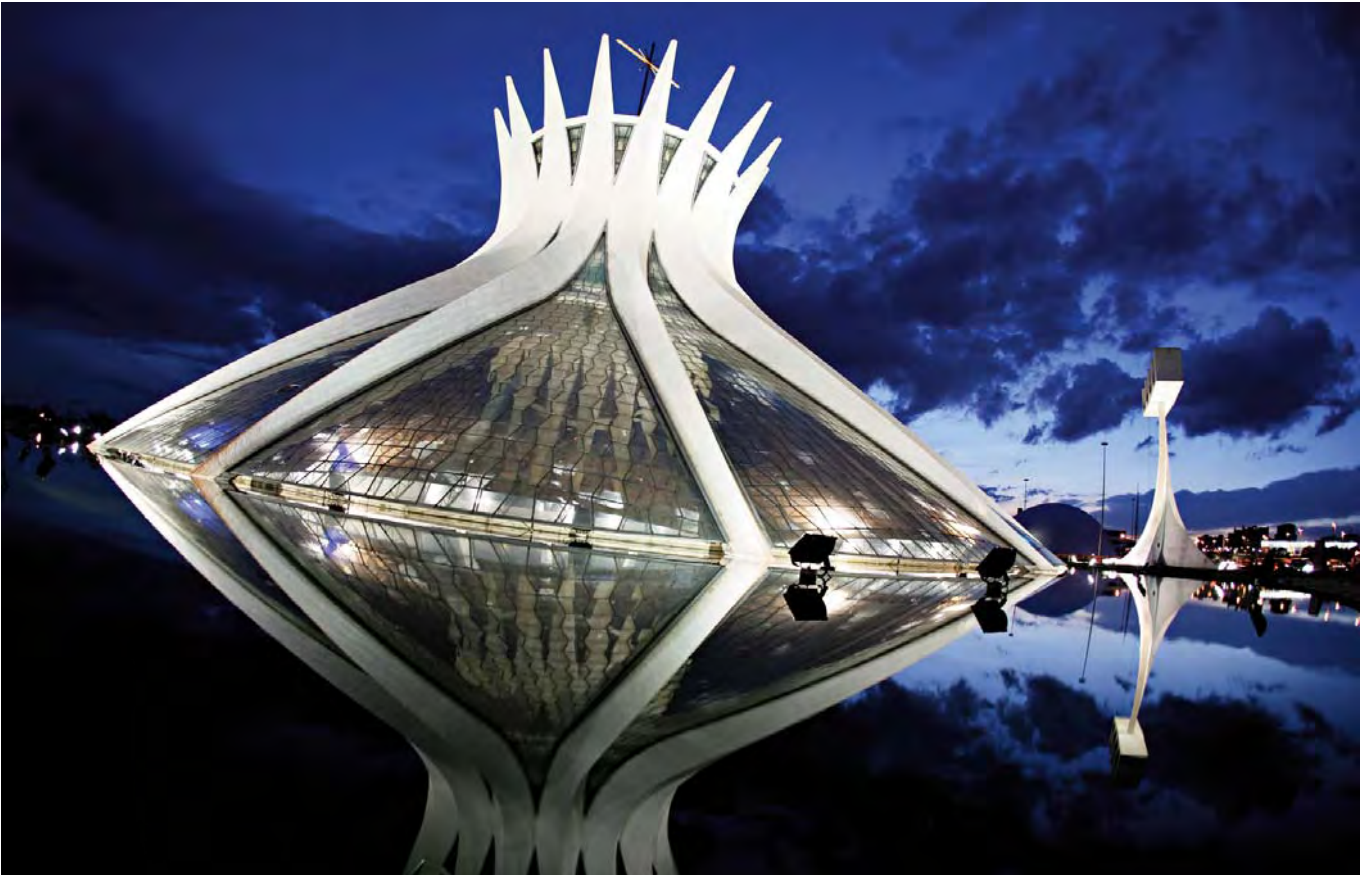
Catedral de Brasilia