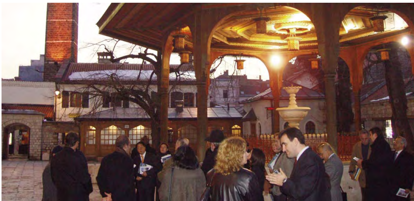
Barrio antiguo de Sarajevo (Bascarsija)