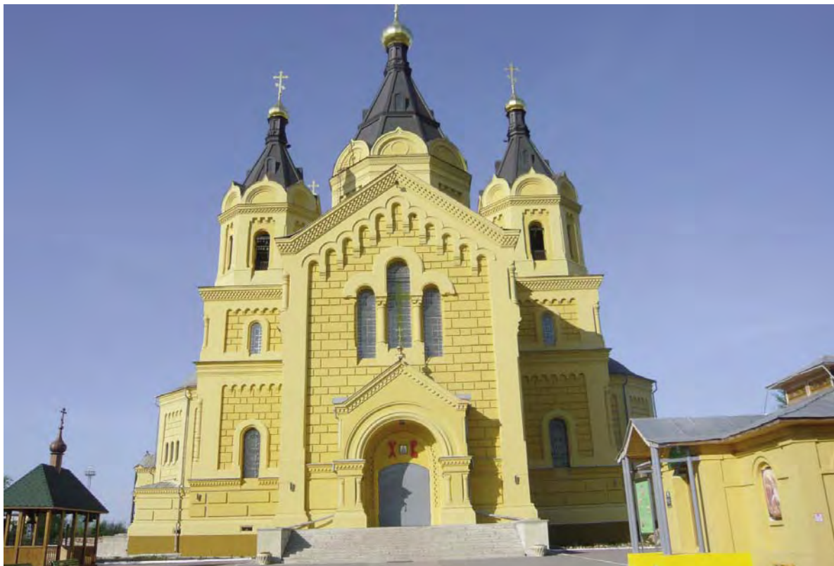
Catedral de San Alejandro del Neva