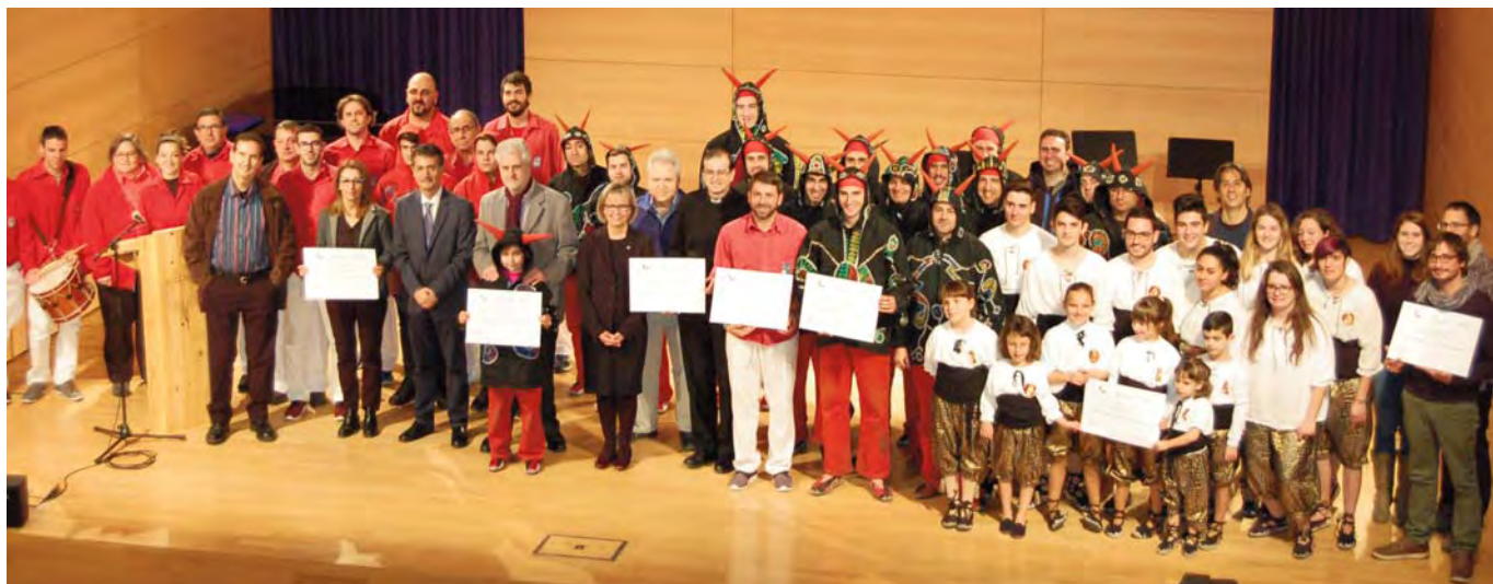
Ceremonia de entrega de reconocimientos a los representantes de los elementos elegidos como 7 Tesoros del Patrimonio Cultural del Vendrell, celebrada el día 14 de Enero de 2017