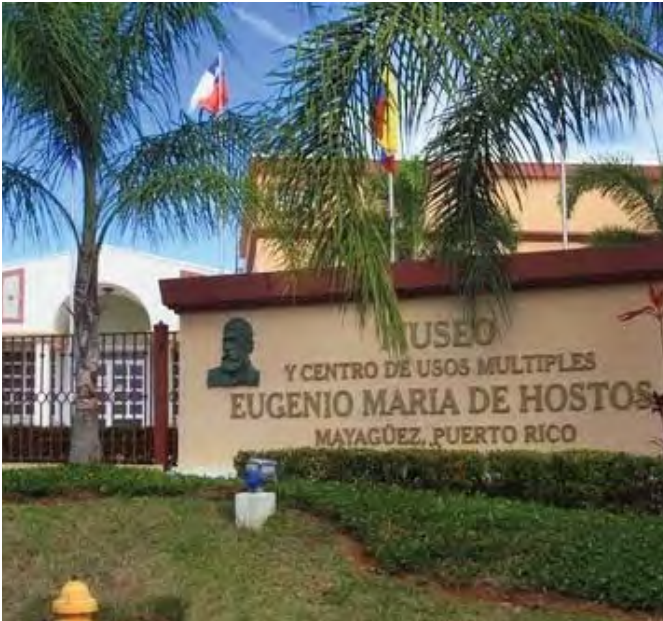
Museo Eugenio María de Hostos